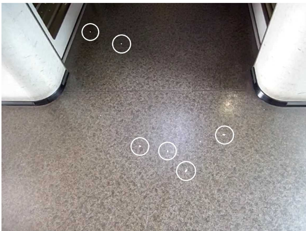
【写真5】2021（令和3）年8月7日の「こだま824号」が新尾道駅に停車中に3号車の喫煙ルームで行った実験を撮影した動画【甲62号証】で、再生開始から約54秒後の画面。6片の紙吹雪（印）が喫煙ルームの外の通路に散乱している。