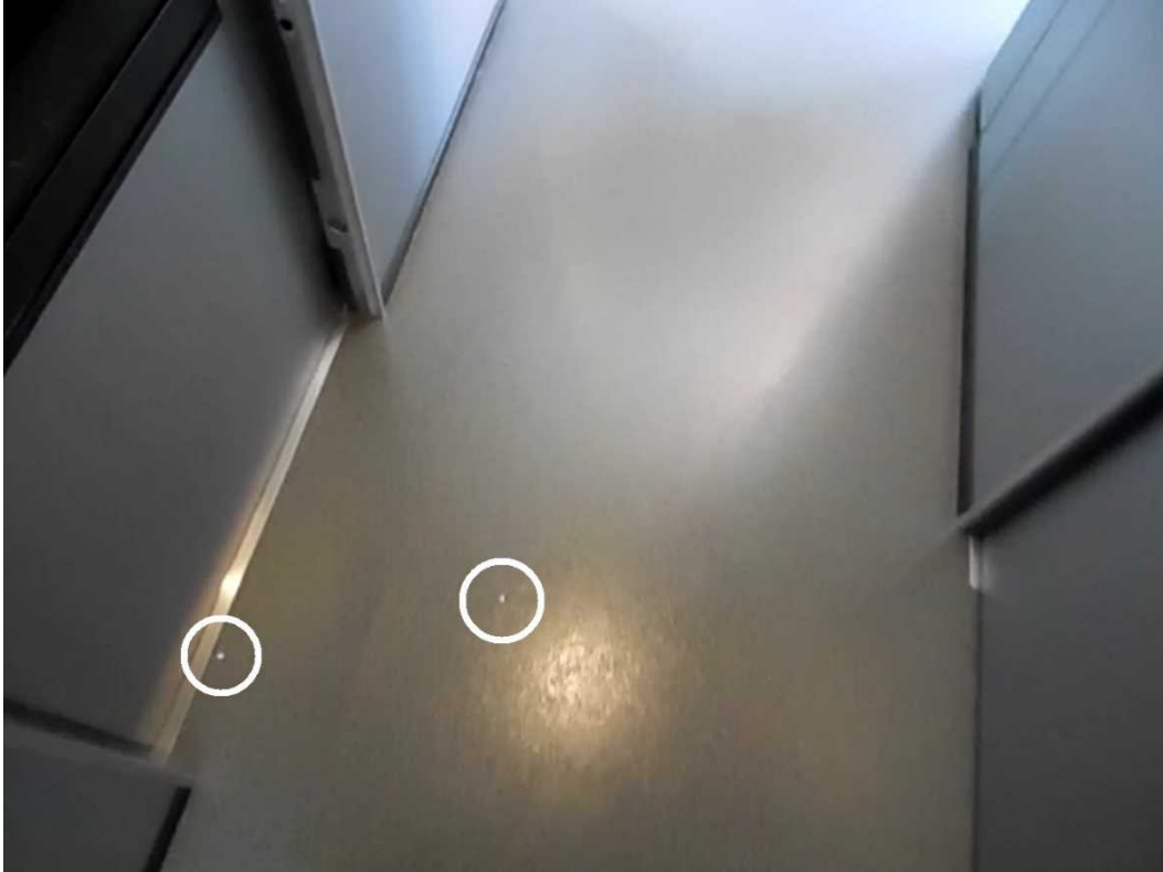
【写真1】2021（令和3）年8月5日の「こだま703号」が三河安城駅に停車中に15号車の喫煙ルームで行った実験を撮影した動画【甲58号証】で、再生開始から約39秒後の画面。2片の紙吹雪（印）が喫煙ルームの外の通路に散乱している。