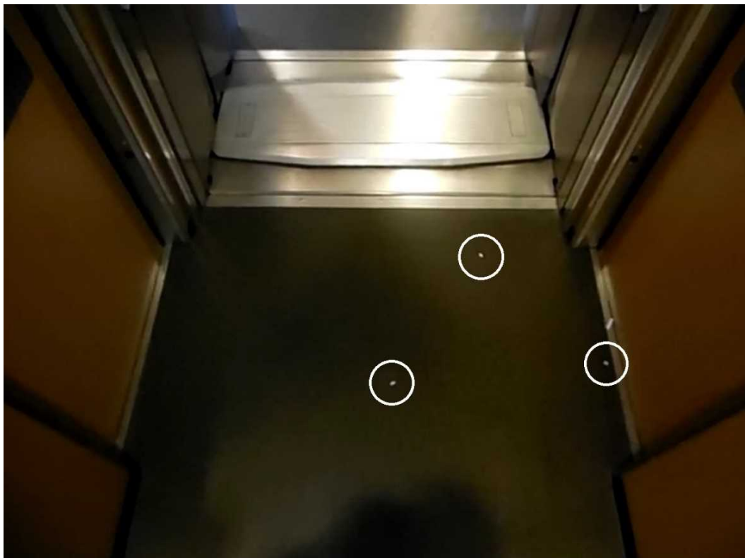
【写真3】2021（令和3）年8月7日の「つばめ307号」の博多駅発車前に3号車の喫煙ルームで行った実験を撮影した動画【甲60号証】で、再生開始から約40秒後の画面。3片の紙吹雪（印）が喫煙ルームの外の通路に散乱している。