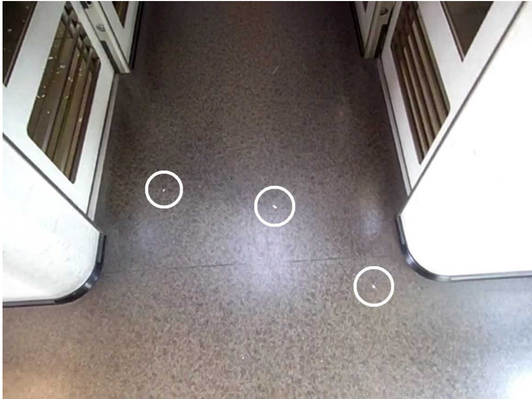
【写真6】2021（令和3）年8月7日の「こだま824号」が新倉敷駅に停車中に3号車の喫煙ルームで行った実験を撮影した動画【甲63号証】で、再生開始から約47秒後の画面。3片の紙吹雪（印）が喫煙ルームの外の通路に散乱している。