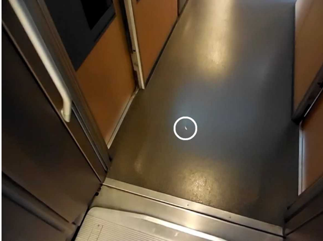
【写真2】2021（令和3）年8月5日の「さくら553号」の新大阪駅発車前に3号車の喫煙ルームで行った実験を撮影した動画【甲59号証】で、再生開始から約41秒後の画面。1片の紙吹雪（印）が喫煙ルームの外の通路に散乱している。