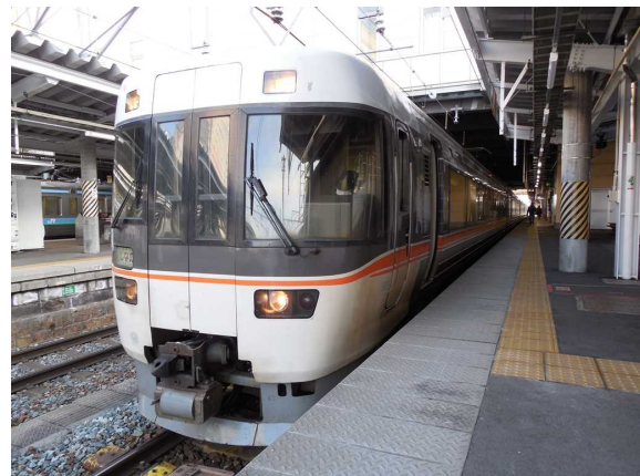
J R東海383系の名古屋方先頭車