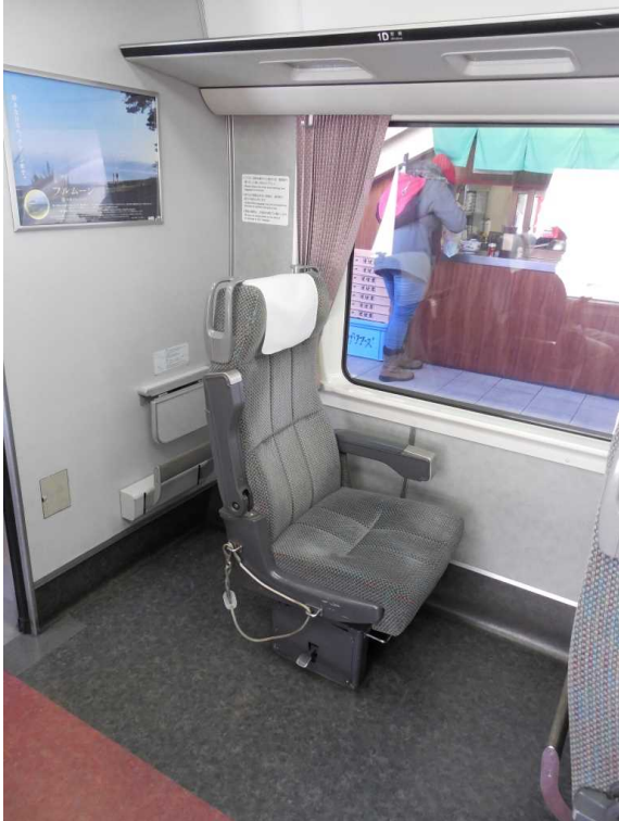
383系2号車の車いす対応座席