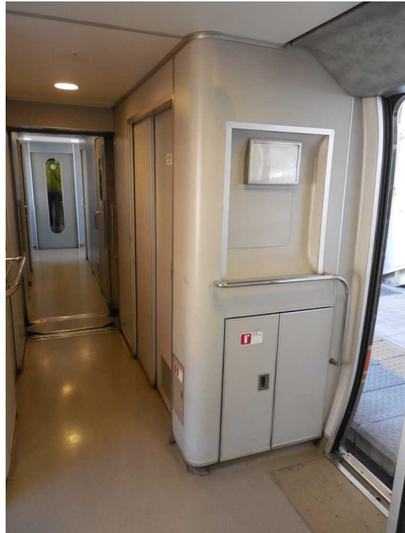
383系2号車の公衆電話撤去跡 奥は車内販売準備室