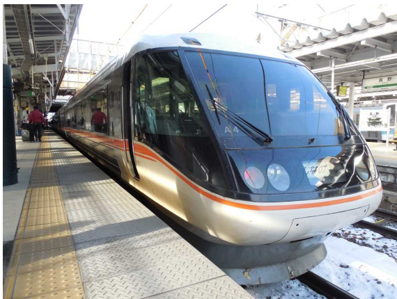
J R東海383系の長野方先頭車 (パノラマ型グリーン車)