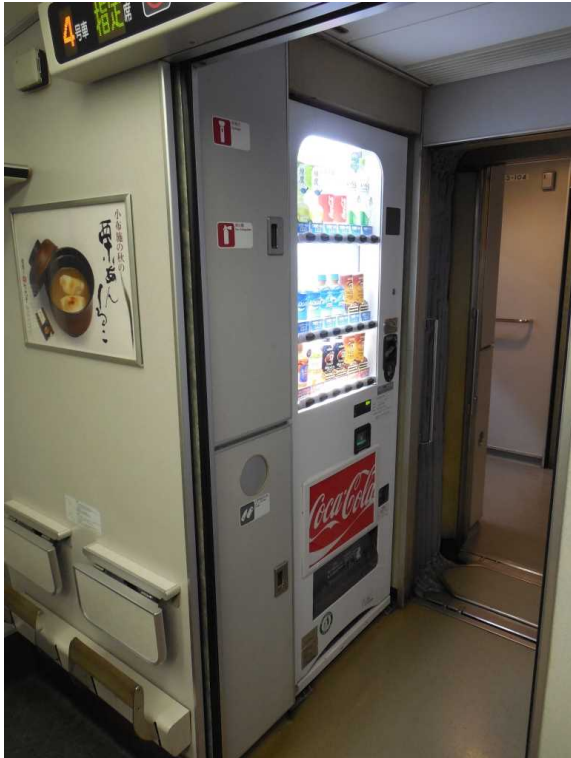
383系4号車の飲料自動販売機