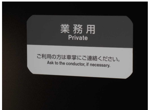
383系1号車の多目的室の案内掲示 「業務用」と不適切な表記