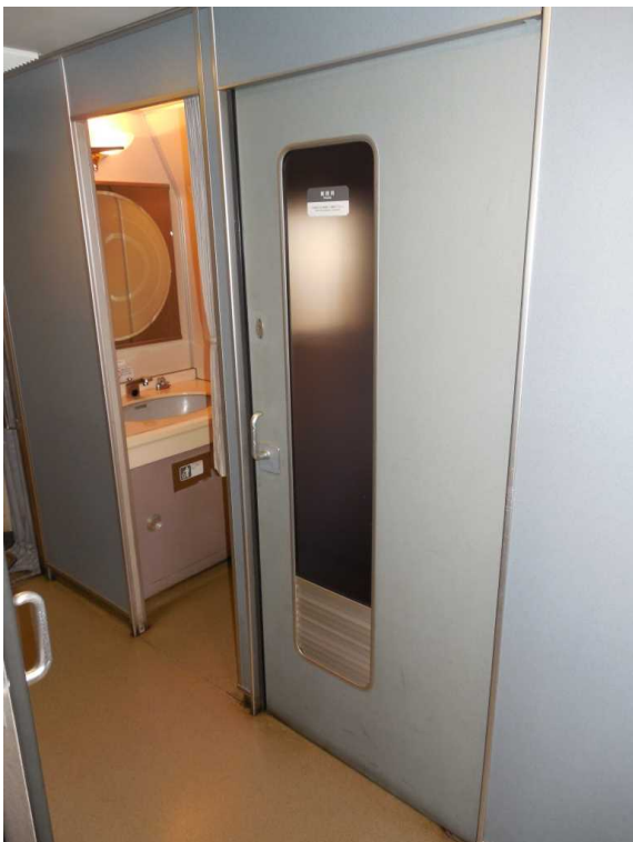
383系1号車の多目的室と洗面所(車いす非対応)