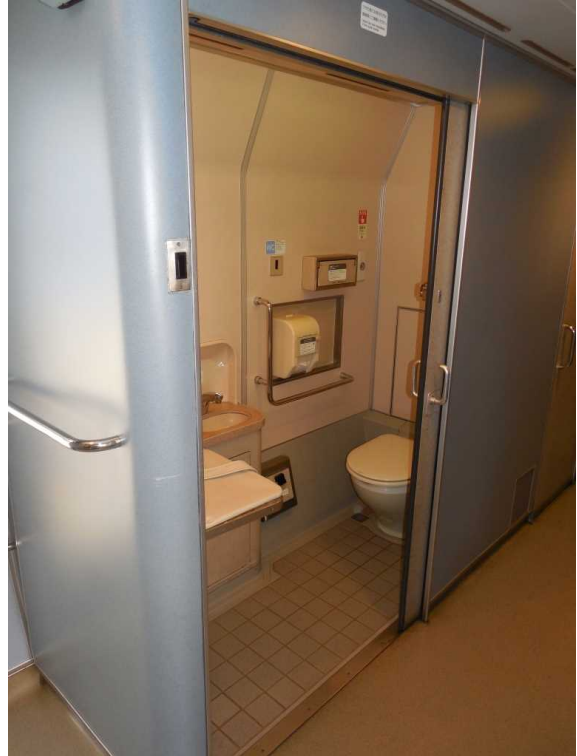
383系1号車の多機能トイレ