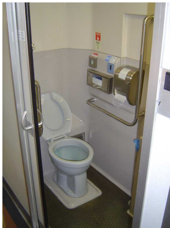
キハ75形の車いす対応トイレ