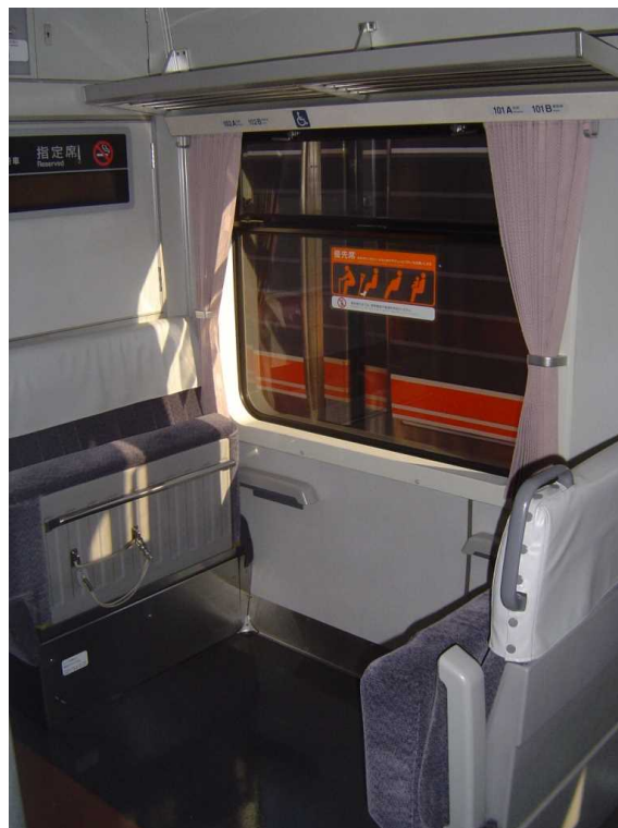
キハ75形の車端部ボックス席の座面を 跳ね上げ車いすスペースとした状態 車いす固定用のロープも見える