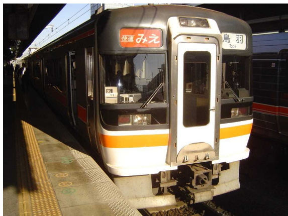
J R 東海キハ75形 「みえ」は主に前面が黒いデザインの 車両で運転