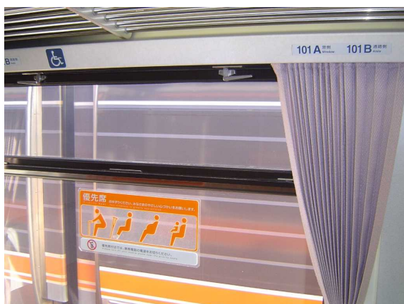
キハ75形の車端部ボックス席の案内表示 (左上の車いすマークに注意)