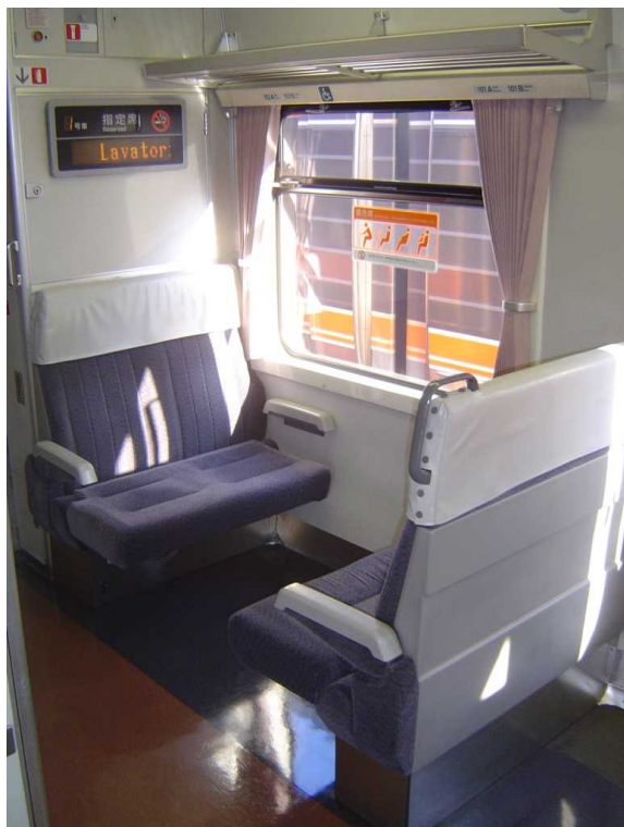
キハ75形の車端部のボックス席 (通常の状態)