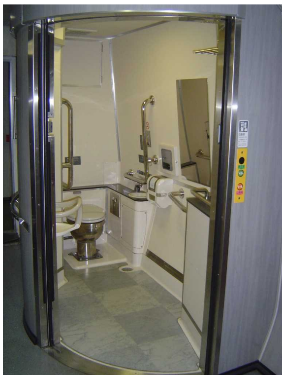
J R東日本253系1000代の多機能トイレ