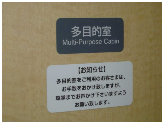
J R東日本253系1000代の多目的室の案内掲示