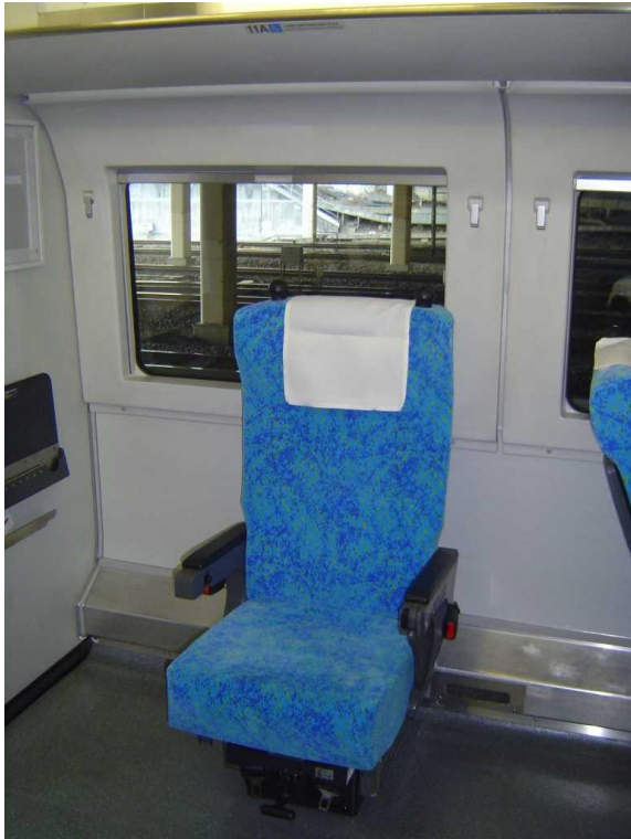
J R東日本253系1000代の 車いす対応座席