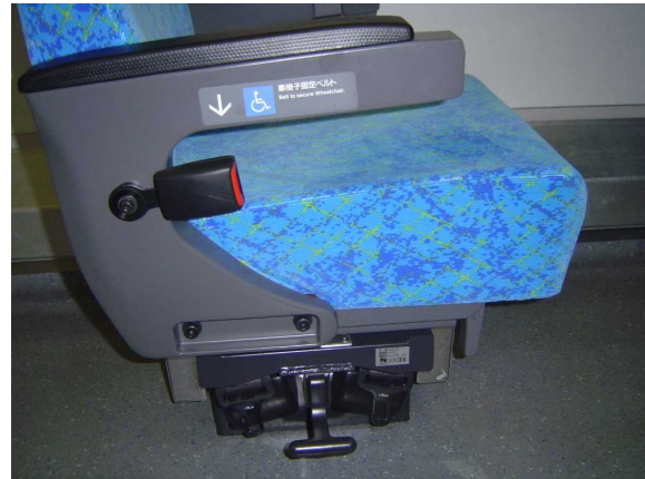
J R東日本253系1000代の 車いす対応座席の車いす固定用ベルト