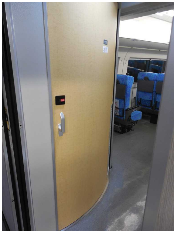
J R東日本253系1000代の多目的室