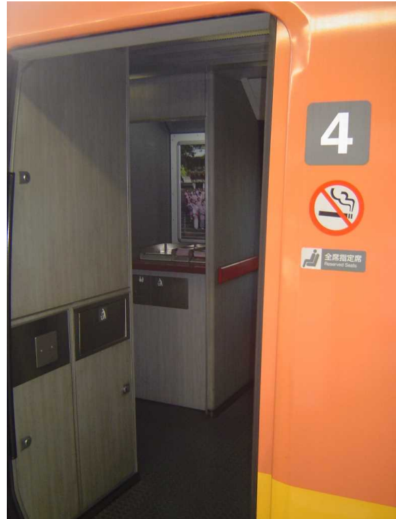
JR東日本253系1000代の 観光パンフレット置場(公衆電話撤去跡) 「成田エクスプレス」時代の公衆電話は 車いす非対応構造だったことがわかる