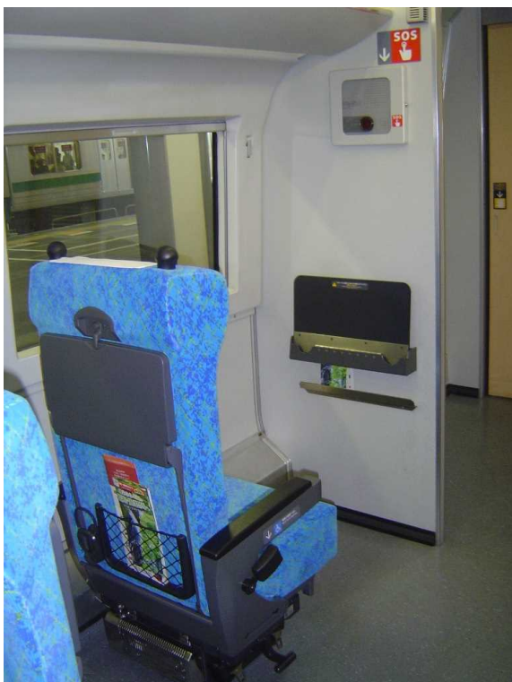
J R東日本253系1000代の 車いす対応座席付近の非常通報器 取付位置が高く車いすの人は手が届かない