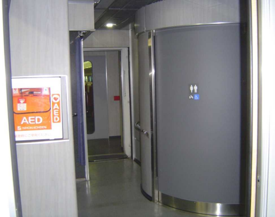
JR東日本253系1000代の 多機能トイレの向かいに設置されたAED