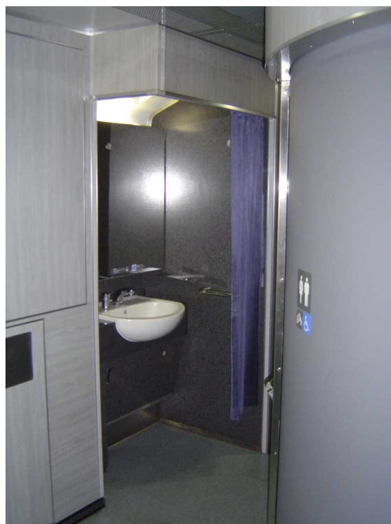
J R東日本253系1000代の洗面所