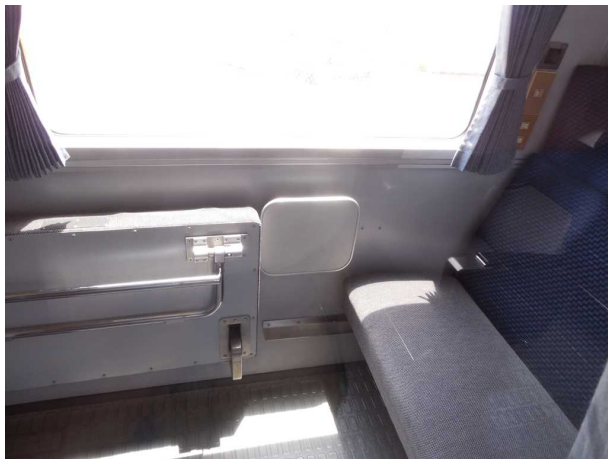
J R東日本255系の多目的室の内部を 窓越しに見たところ