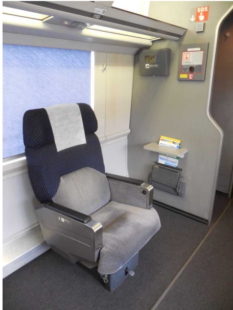
J R東日本255系の 4号車(グリーン車)の車いす対応座席 (11番D席) 右上に防犯カメラと非常通話器が見えるが 車いすの人には手が届かない高さ