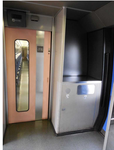
J R東日本255系の6号車の 東京湾側の荷物置場 ここで布団を運ぶ場面も見かけた