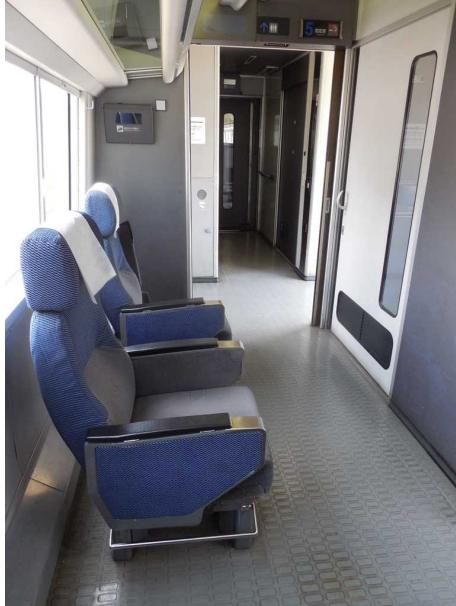
J R東日本255系の5号車の 車いす対応座席(左)と 多目的室(右)との位置関係 多目的室の案内掲示は何も無く カーテンの開閉で空室か在室かを区別 1993年製造の車両では 床に細かい凸凹がある