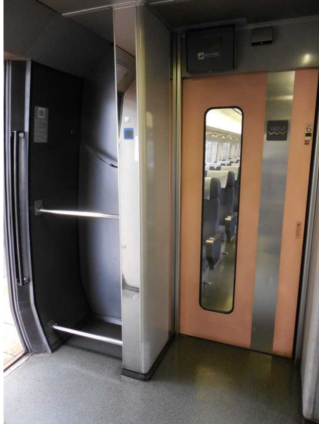
J R東日本255系の6号車の 太平洋側の荷物置場 サーフボードがすっぽり収まる大きさ