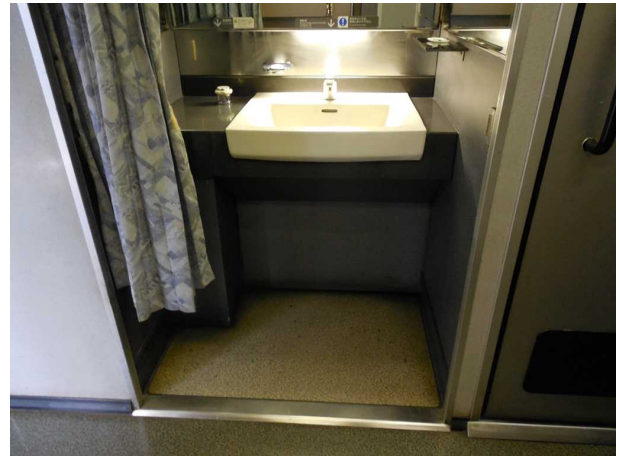
J R東日本255系の5号車の 車いす対応洗面所 向かいの多機能トイレの中から撮影