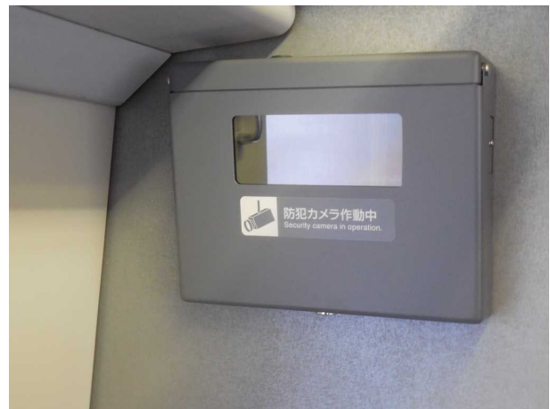
同じく防犯カメラの拡大写真 こちらも運行開始当初には無く 2015年のリニューアル改造時に 追設されたもの