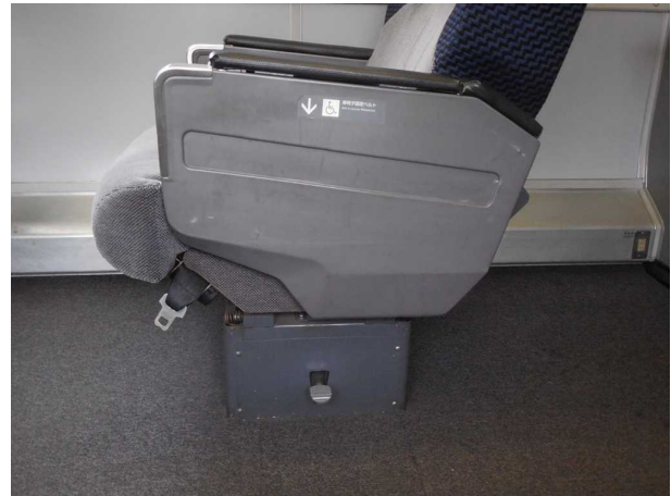
左の写真で腰掛の台座部分を拡大した様子 自動車のシートベルトと同じタイプの 車いす固定ベルトが設置されている