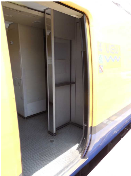
J R東日本255系の4号車の 公衆電話撤去跡(右手前) 車いす対応座席から往復できない場所の上 間口が狭く電話機取付位置も高かったため 車いすでの利用は不可能だった 4号車には飲料自動販売機は無かった