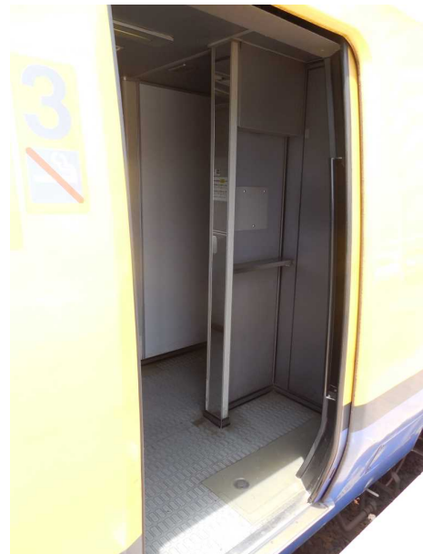
J R東日本255系の3号車の 公衆電話(右手前)と 飲料自動販売機(左奥)の撤去跡 8号車も同じ構造