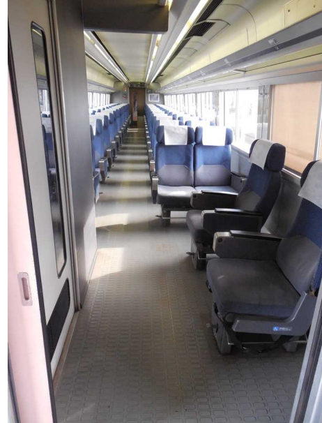
左の写真と同じ場所を デッキから見たところ 上端に見えているのは文字案内表示器 多目的室に隠れて見えなくなってしまう この位置に設置されているが これでは車いす対応座席からは 文字案内を見ることができない