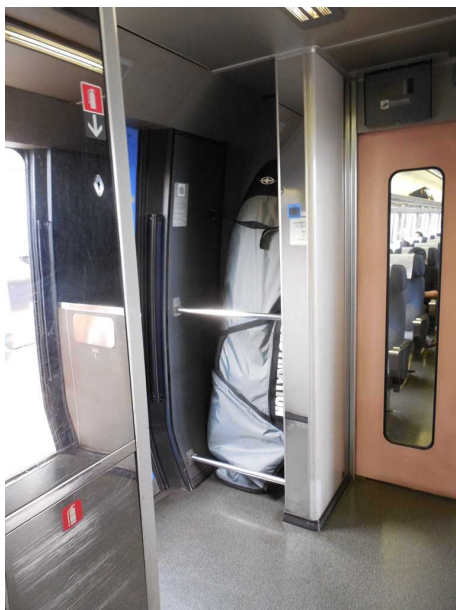
上の写真の荷物置場に サーフボードを収容した様子