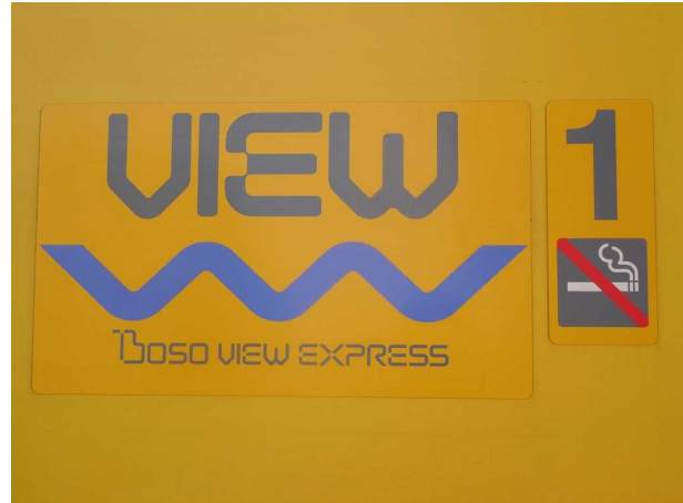
J R東日本255系の車体側面のロゴ