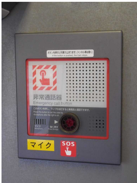
上の写真で右上に見えている非常通話器の 拡大写真 運行開始当初には無く 2015年のリニューアル改造時に 追加設置