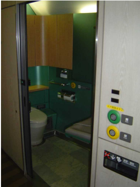
E257系の多機能トイレ