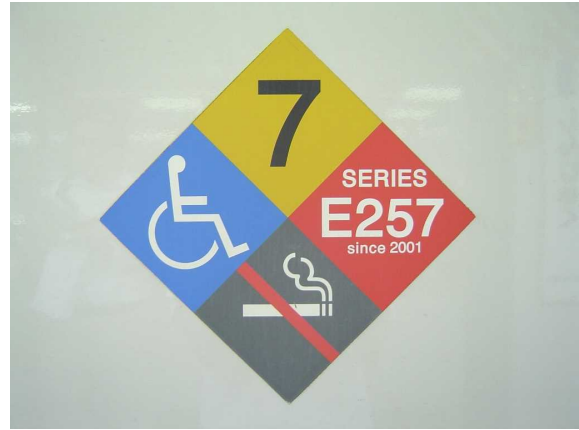
J R東日本E 2 5 7系