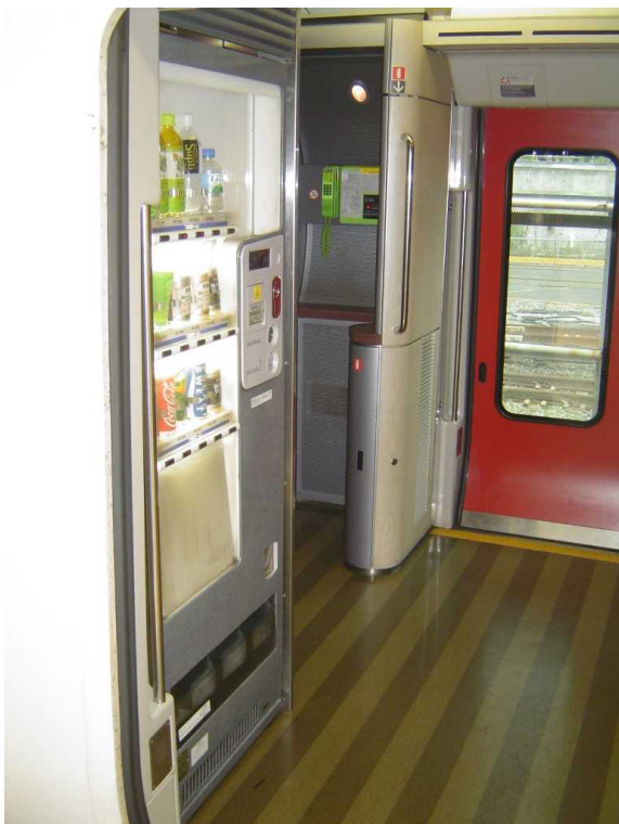
E257系の公衆電話と飲料自動販売機 (現在はいずれも撤去) いずれも車いす対応構造ではなかった