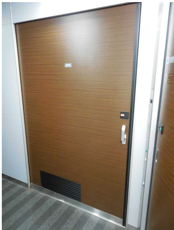
E 2 5 9 系の多目的室 右は多機能トイレ