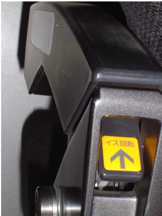
E259系のイス回転レバー 肘掛けの後部にあるのは珍しく 気づきにくい