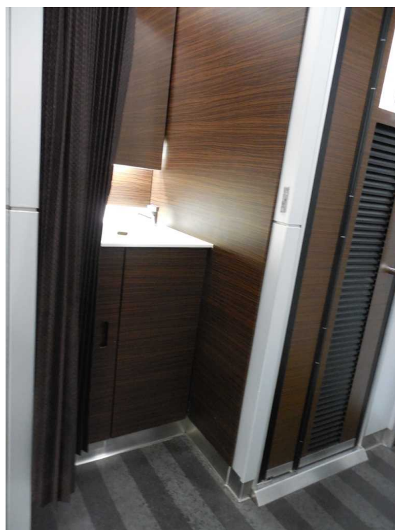
E 2 5 9 系の1号車の洗面所 車いす対応座席からは離れており 車いすでの利用を想定した設計ではない