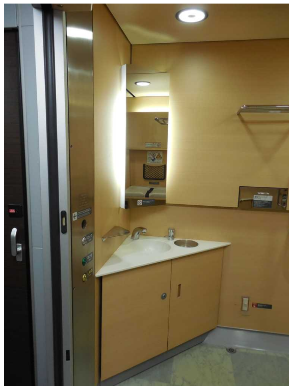
E259系の多機能トイレ内の洗面台 足元の蹴り込み空間が無い ため車いすで利用するには不便