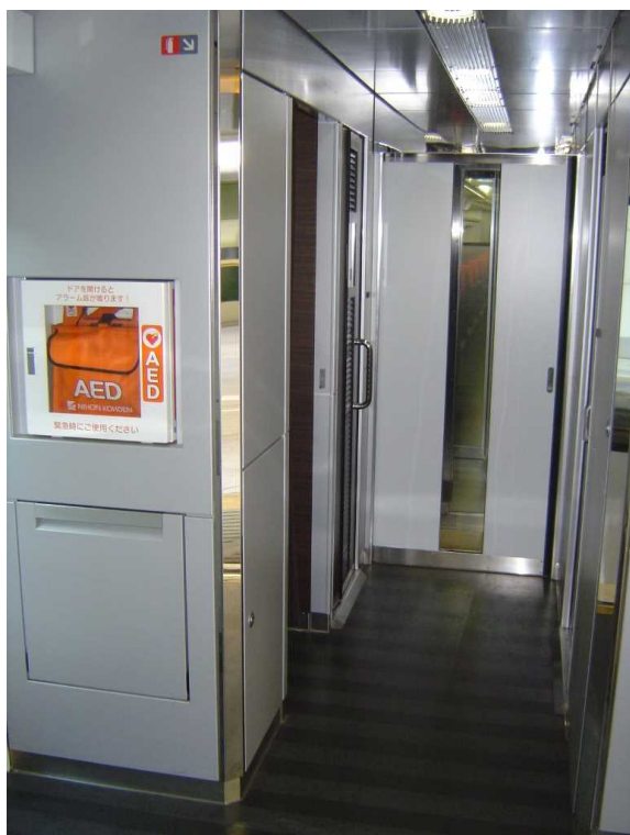
E 2 5 9 系の1号車のデッキのA E D 右の写真の洗面所はA E Dの裏に位置する