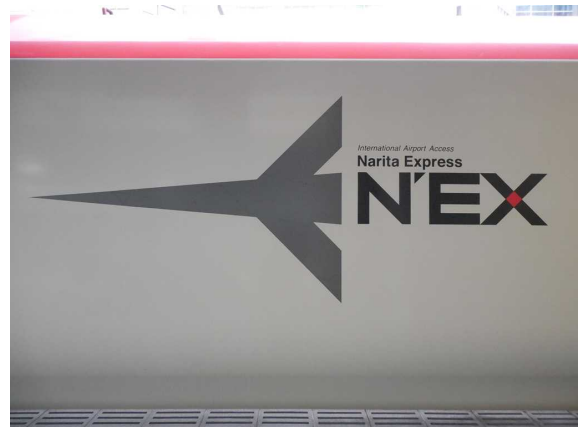
J R東日本E 2 5 9系