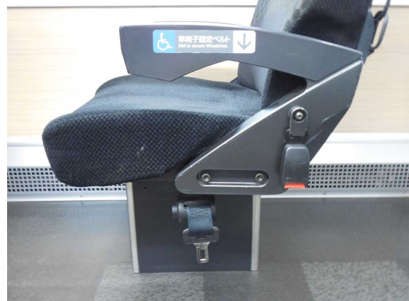
E259系の車いす対応座席の 車いす固定用ベルト