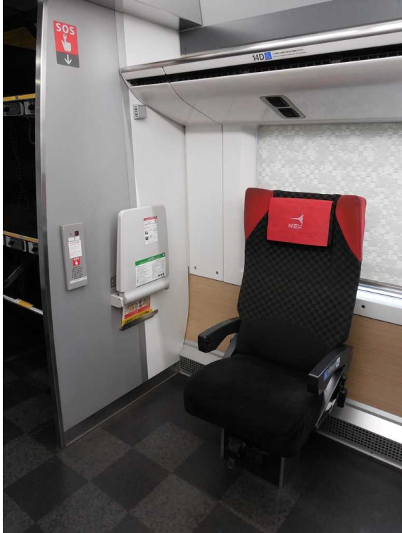
E259系の車いす対応座席 壁には対話式の非常通報装置