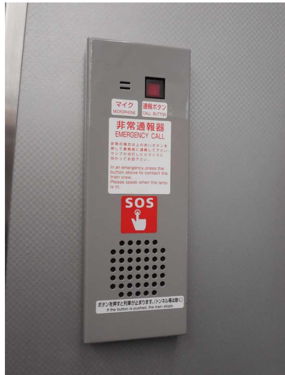
E259系の非常通報器 車いす対応座席付近以外の物は 壁面の折り畳みテーブルよりも高い部分に 設置されている