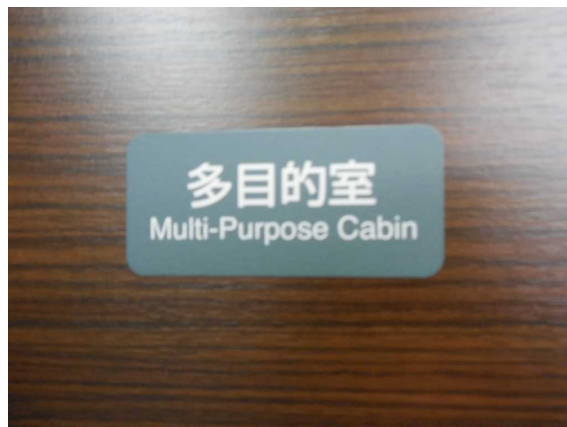
E 2 5 9 系の多目的室の掲示 利用方法などの案内が何も無い