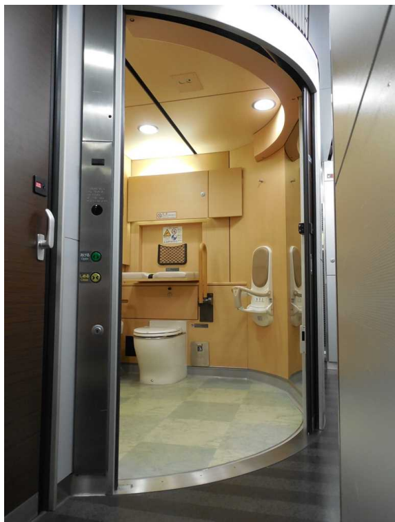
E259系の多機能トイレ 左は多目的室