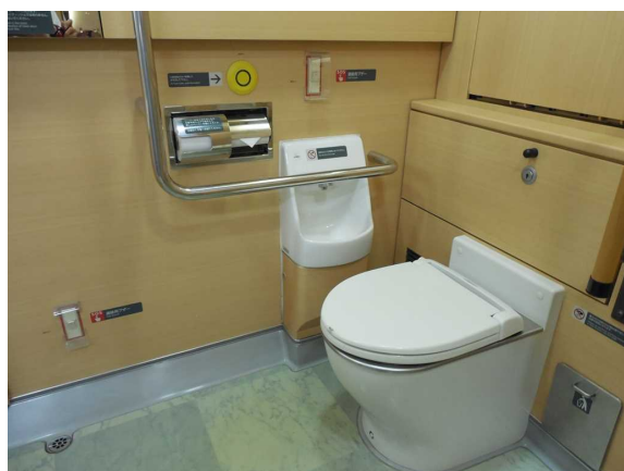
E259系の多機能トイレ内の 緊急呼び出しブザー 転倒時でも手が届くよう床面近くにも設置