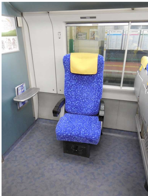
E653系「いなほ」4号車の 車いす対応座席