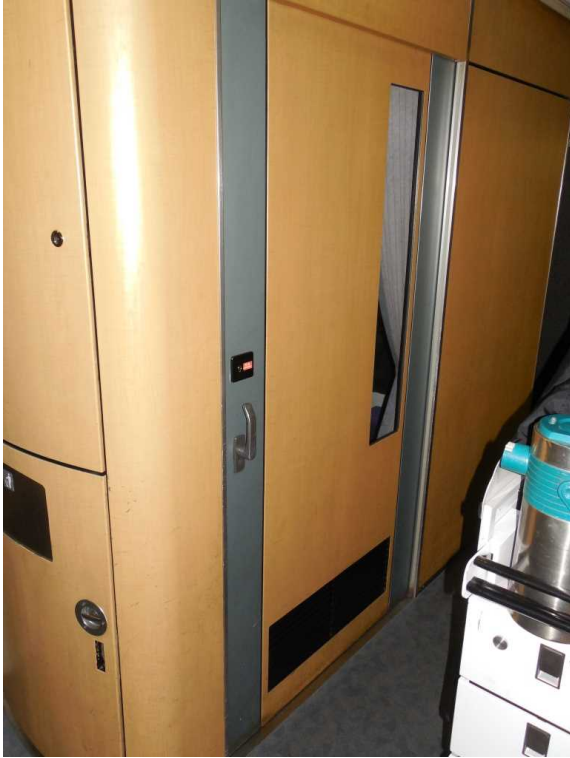
E653系「いなほ」4号車の多目的室