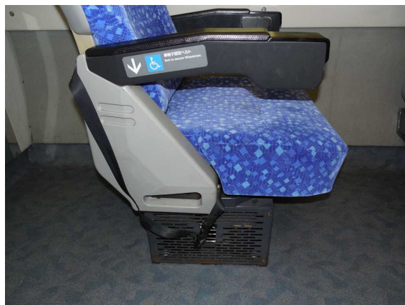
E653系「いなほ」4号車の 車いす固定ベルト