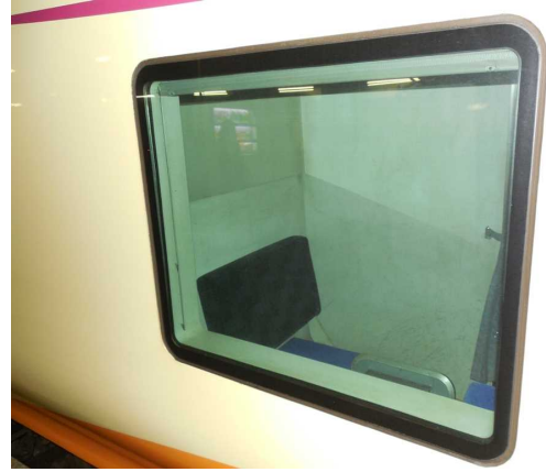
E653系「いなほ」4号車の多目的室の内部（ホームから撮影）