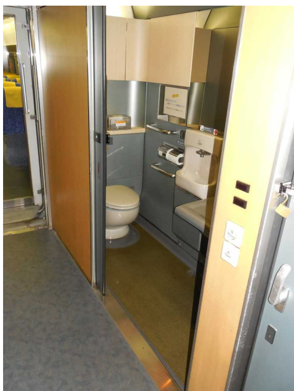
E653系「いなほ」4号車の 多機能トイレ