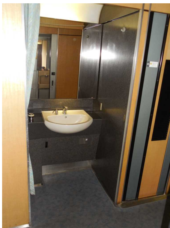
E653系「いなほ」4号車の 車いす対応洗面所