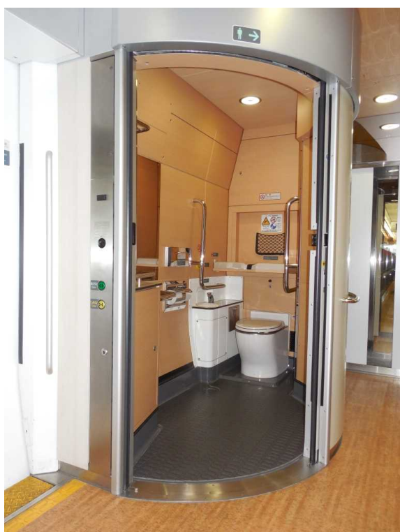
「リゾートビューふるさと」の 多機能トイレ