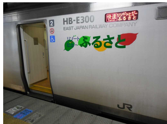
JR東日本HB-E300系「リゾートビューふるさと」 乗降口のステップ(段差)にも注意