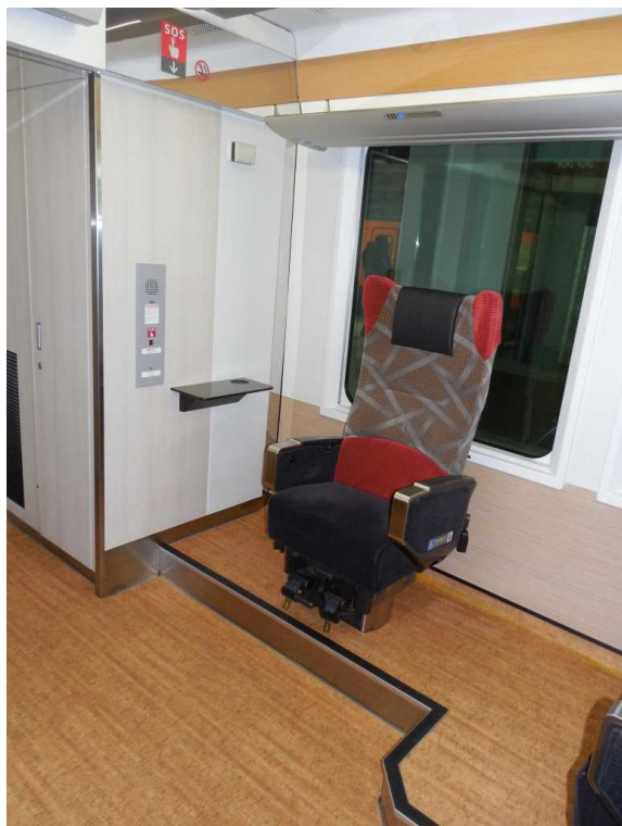
「リゾートビューふるさと」の 車いす対応座席