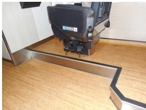
「リゾートビューふるさと」の 車いす固定ベルト