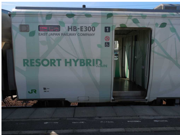
ブナ編成の車体側面のロゴと デッキの段差