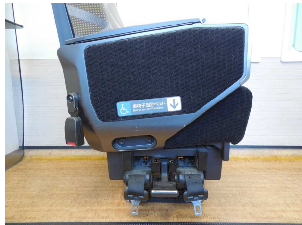
青池編成の車いす固定ベルト