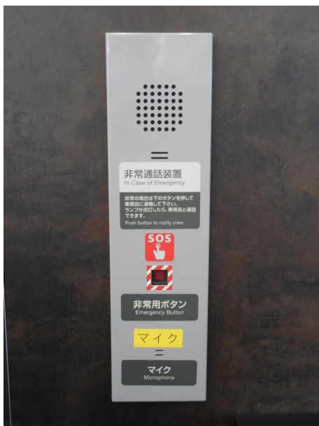
ブナ編成の車いす対応座席の非常通話装置