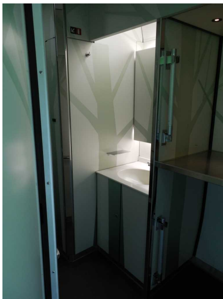
ブナ編成の洗面所