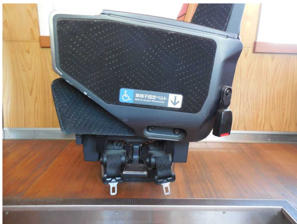
ブナ編成の車いす固定ベルト