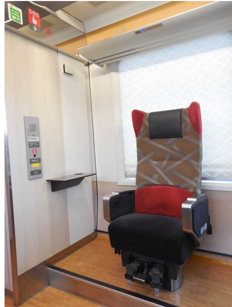
青池編成の車いす対応座席と非常通話装置