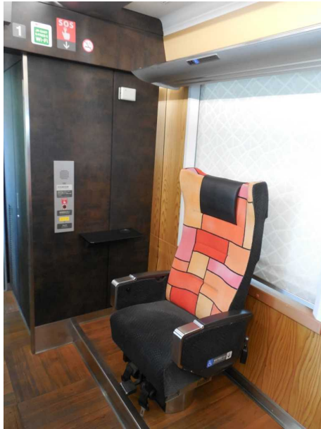
ブナ編成の車いす対応座席と非常通話装置