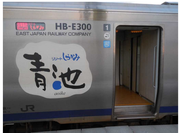
青池編成の車体側面のロゴと デッキの段差