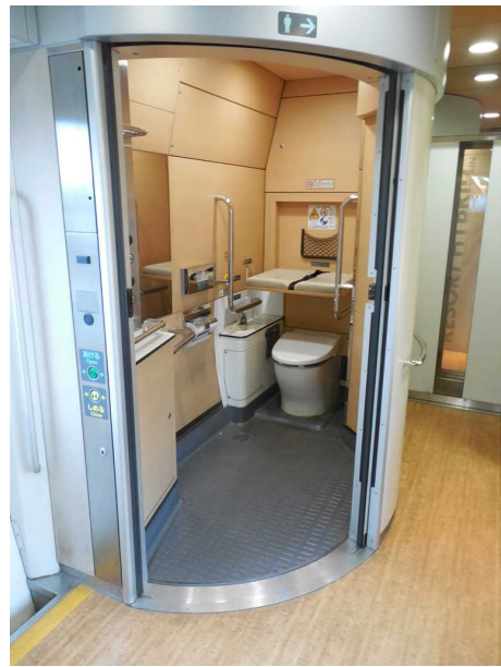
青池編成の多機能トイレ