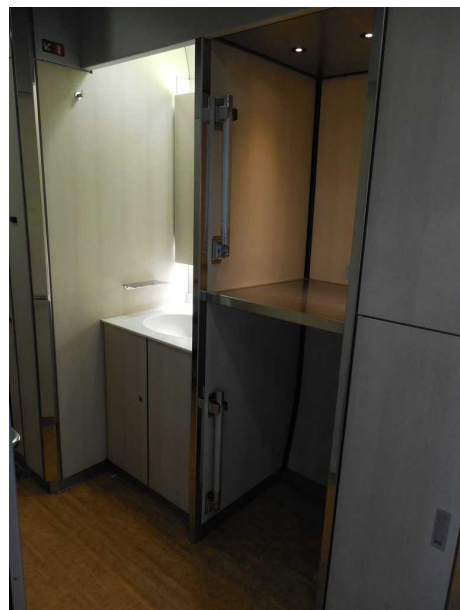
青池編成の洗面所