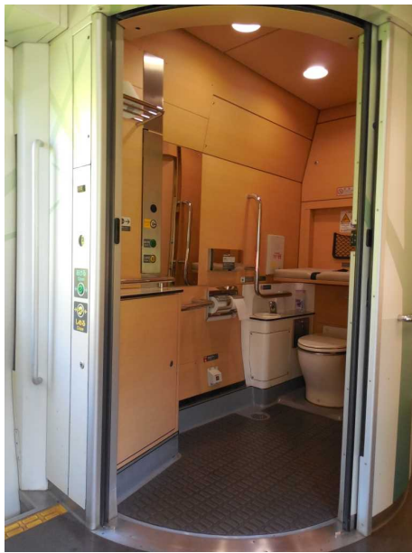
ブナ編成の多機能トイレ