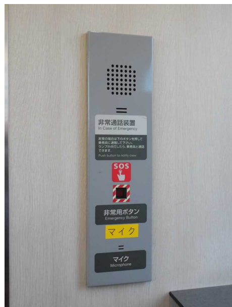
青池編成の車いす対応座席の非常通話装置