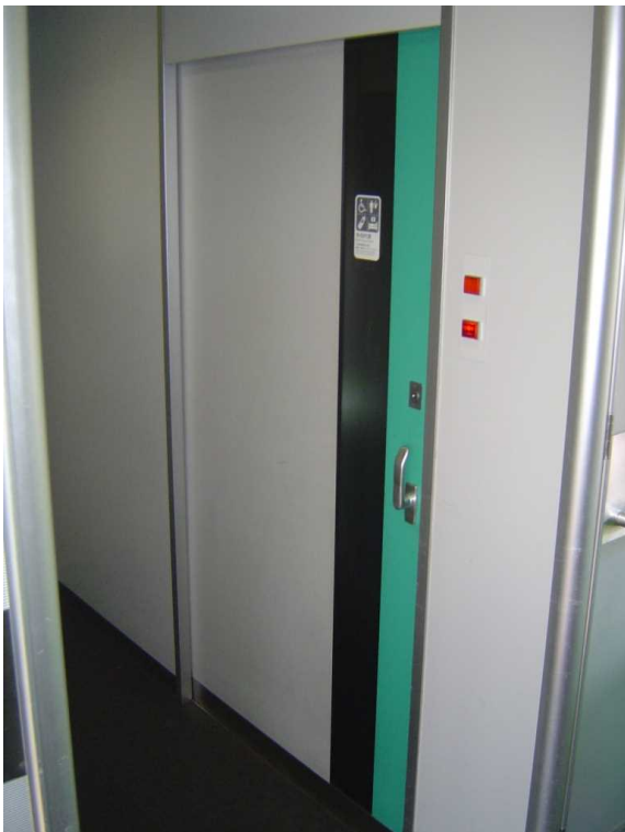
J R北海道789系「スーパー白鳥」の 多目的室