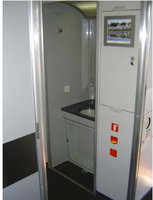
J R北海道789系「スーパー白鳥」の 車いす対応洗面所