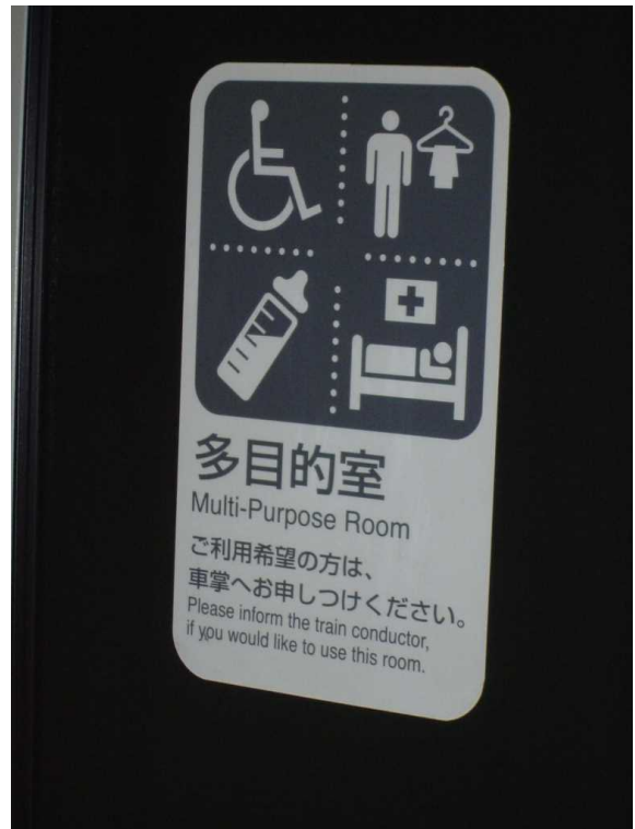
J R北海道789系「スーパー白鳥」の 多目的室の案内掲示