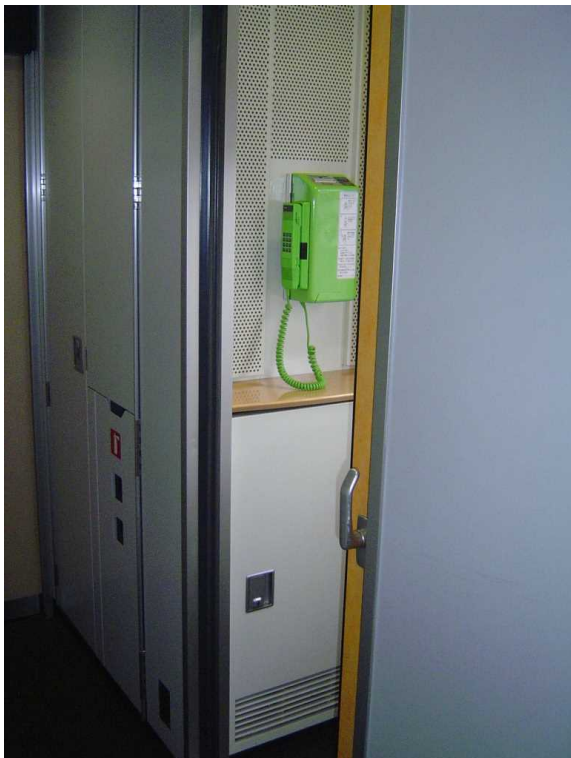
J R北海道789系「スーパー白鳥」に 設置されていた公衆電話（現在は撤去）