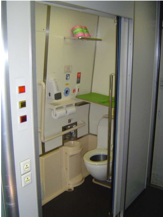
J R北海道789系「スーパー白鳥」の 多目的トイレ