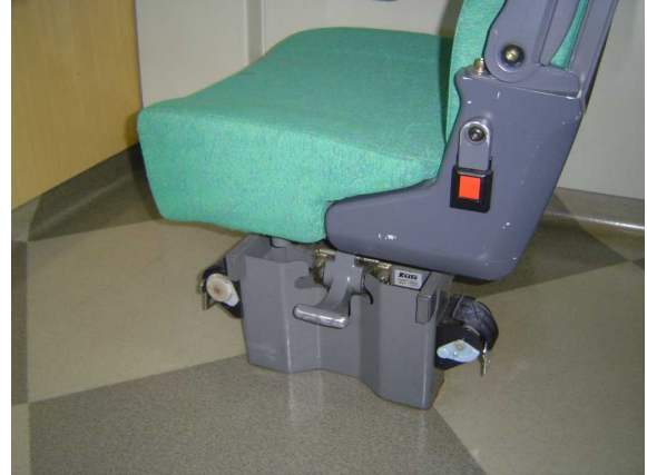
J R北海道789系「スーパー白鳥」の 車いす固定用ベルト