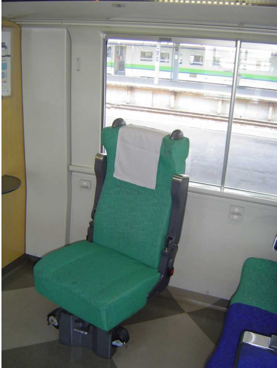
J R北海道789系「スーパー白鳥」の 車いす対応座席