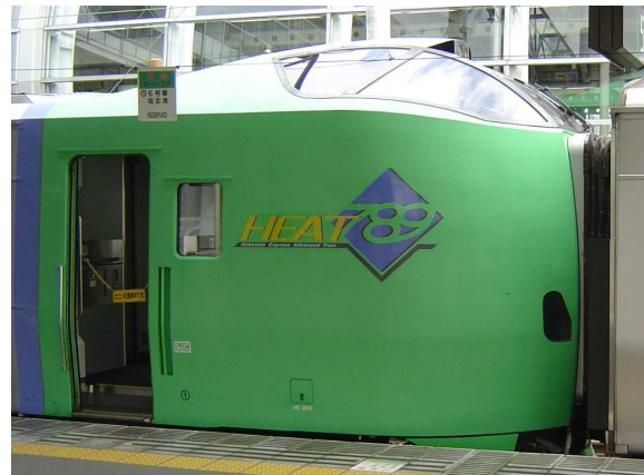
J R北海道789系「スーパー白鳥」