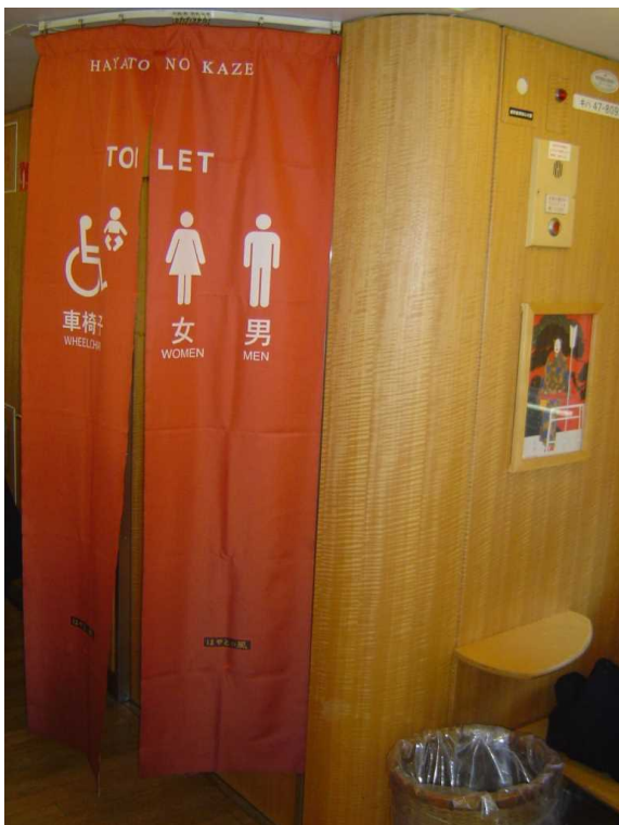
「はやとの風」のトイレの外観