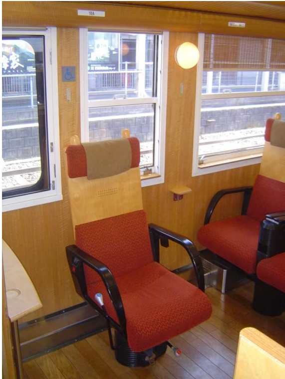
「はやとの風」の車いす対応座席