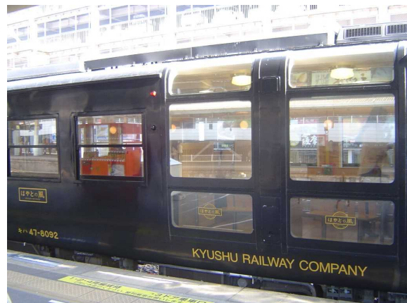
「はやとの風」の車体側面の展望窓