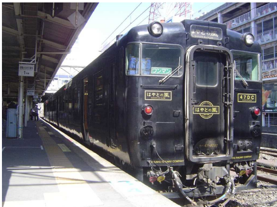
J R九州キハ47形「はやとの風」