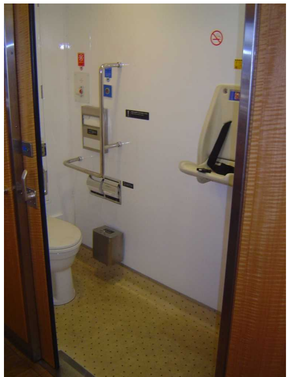
「はやとの風」の車いす対応トイレ