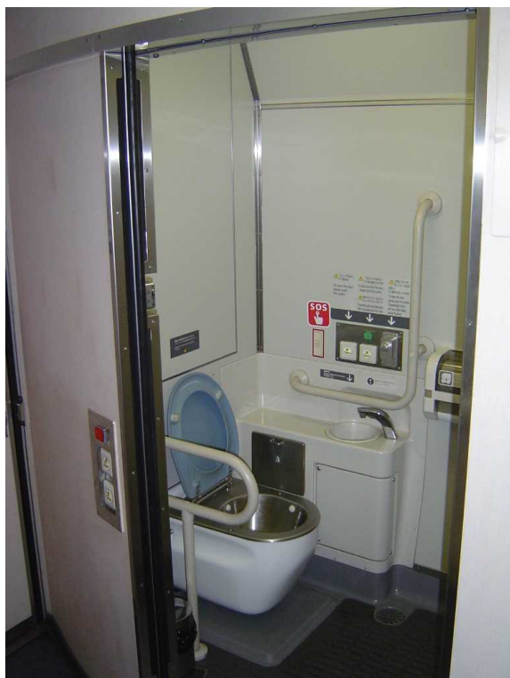
J R 四 国 5 0 0 0 系 の 車 い す 対 応 ト イ レ