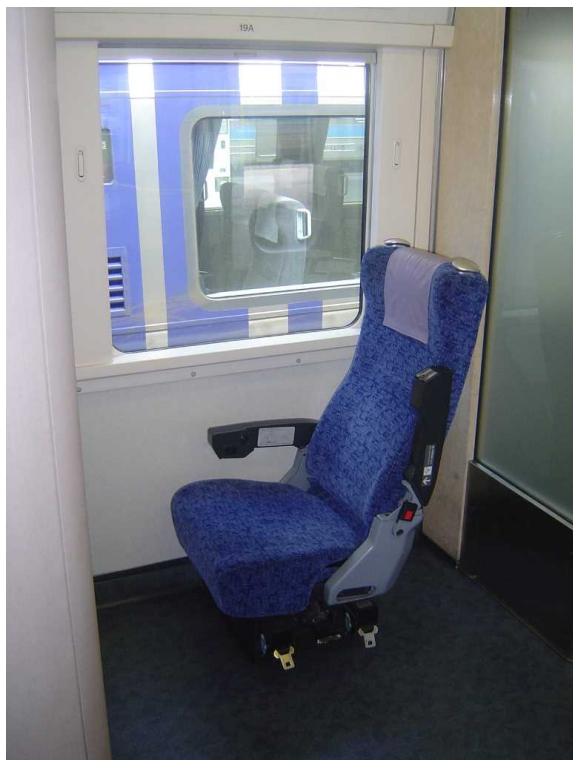
J R 四 国 5 0 0 0 系 の 車 い す 対 応 座 席 A 席 は デ ッ キ と ト イ レ に 挟 ま れ て い る た め 前 後 の 空 間 が D 席 よ り も 狭 い