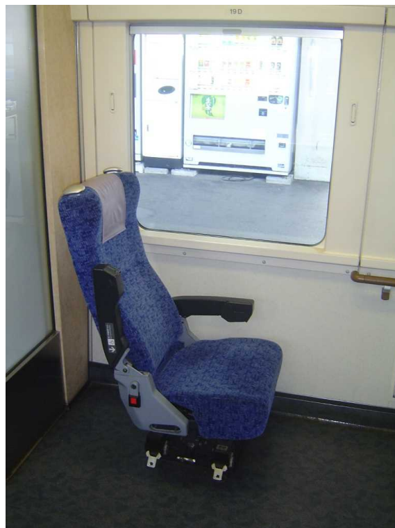
J R 四 国 5 0 0 0 系 の 車 い す 対 応 座 席 D 席 は 上 り 列 車 で は 足 元 が ゆ っ た り