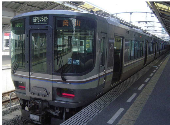
J R 西 日 本 2 2 3 系 ( 岡 山 方 先 頭 車 )