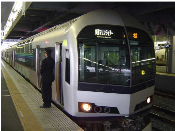
J R 四 国 5 0 0 0 系 ( 高 松 方 先 頭 車 )