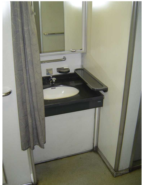
J R 四国 N 2 0 0 0 系の洗面所