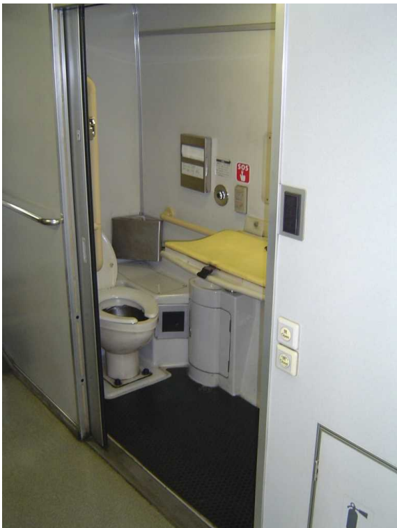
J R 四国 N 2 0 0 0 系の車いす対応トイレ