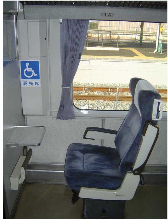
J R 四国 N 2 0 0 0 系の車いす対応座席