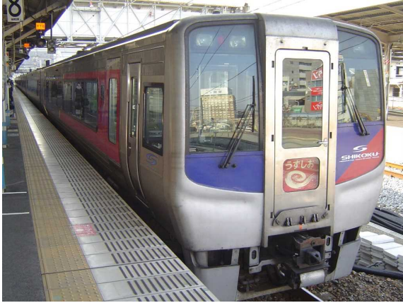
J R 四国 N 2 0 0 0 系