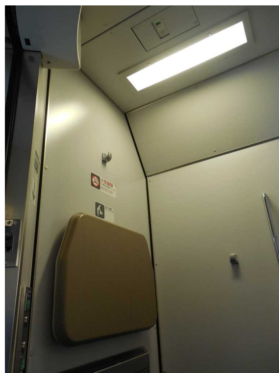
683系「サンダーバード」の多機能トイレ天井の火災報知機