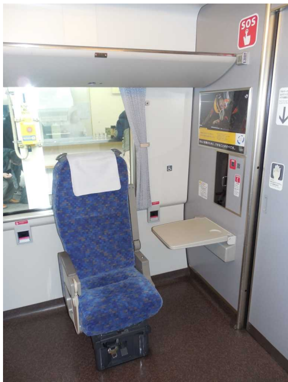
683系「サンダーバード」の 車いす対応座席 窓の下にはコンセントも見える