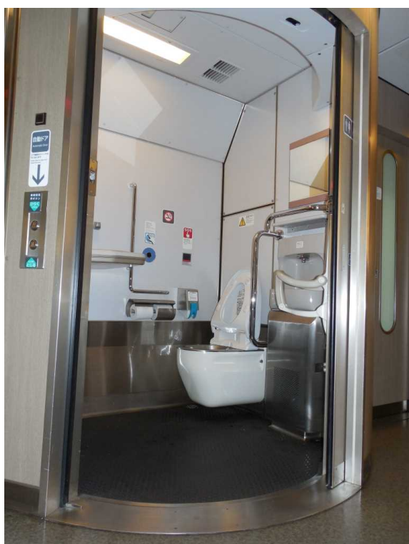
683系「サンダーバード」の多機能トイレ