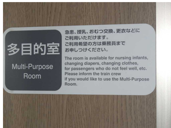
683系「サンダーバード」の多目的室の案内掲示