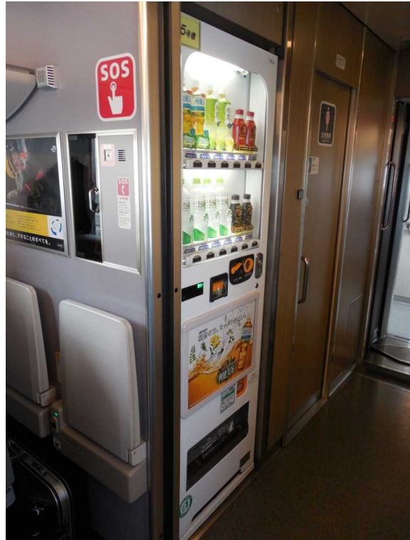
683系「サンダーバード」の 飲料自動販売機（車いす非対応）