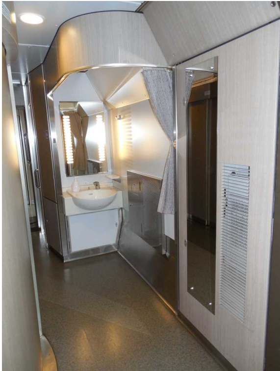
683系「サンダーバード」の 車いす対応洗面所