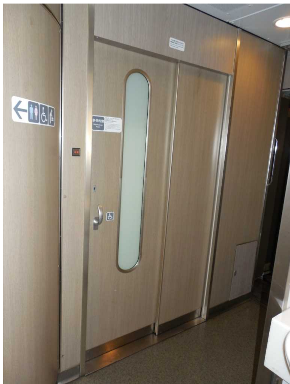
683系「サンダーバード」の多目的室