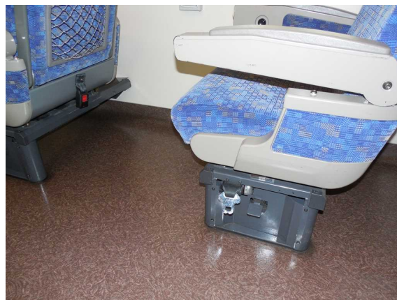
683系「サンダーバード」の 車いす固定用ベルト 台座だけでなく前の席の下部にもある