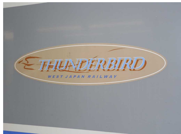
JR西日本683系4000代「サンダーバード」