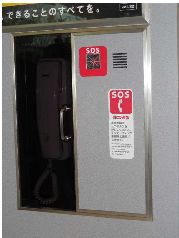
683系「サンダーバード」の 車いす対応座席付近の非常通報器