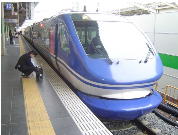
智頭急行HOT7000系 「スーパーはくと」