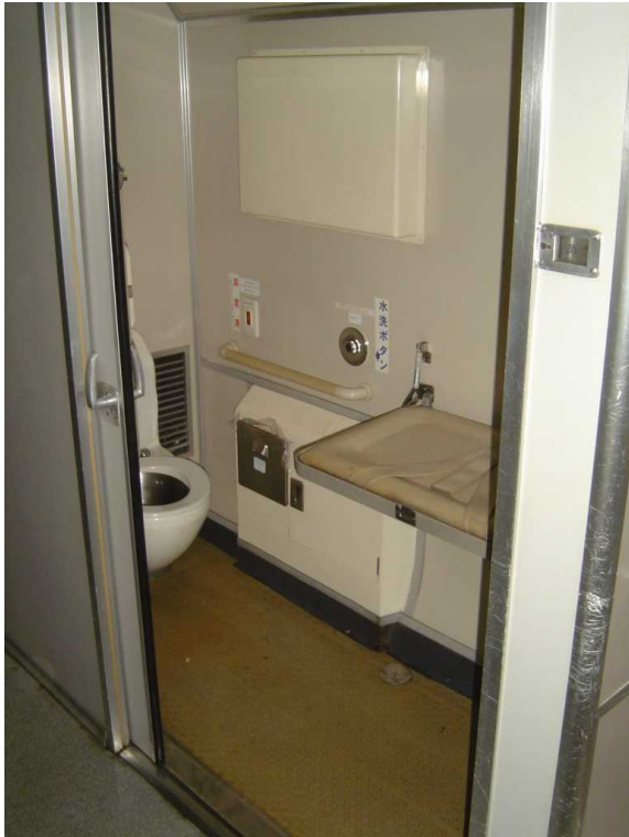
「スーパーはくと」の多機能トイレ