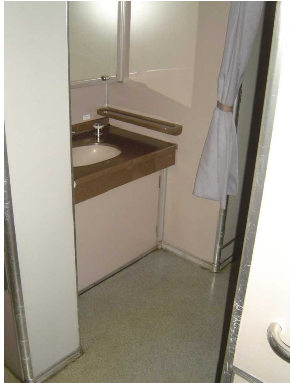
「スーパーはくと」の洗面所