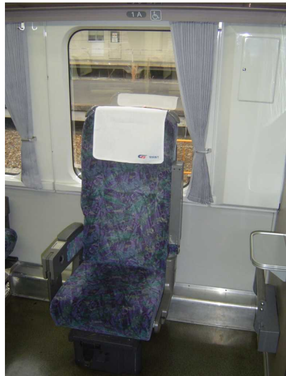
「スーパーはくと」の車いす対応座席