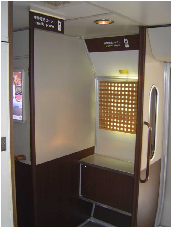
「スーパーはくと」の公衆電話撤去跡