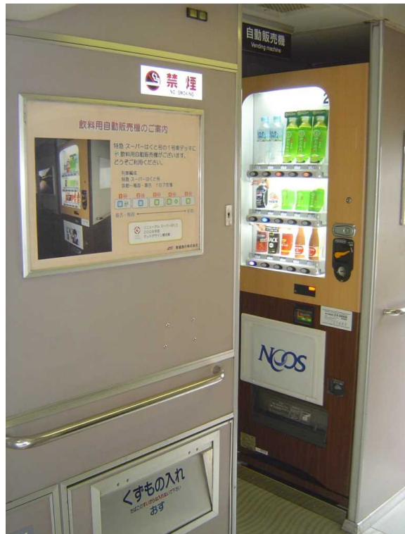
「スーパーはくと」の飲料自動販売機