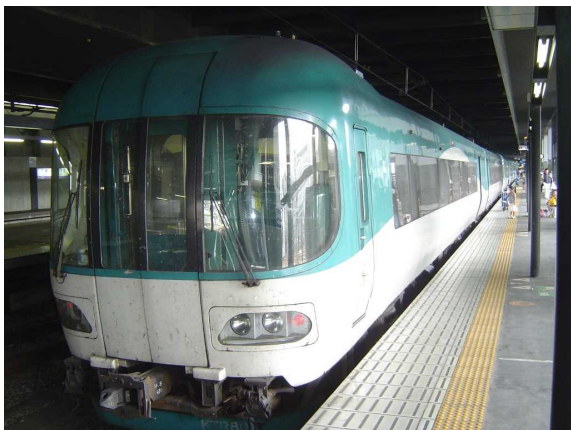
北近畿タンゴ鉄道KTR8000系 「タンゴディスカバリー」