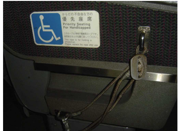
「タンゴディスカバリー」の 車いす固定ロープ