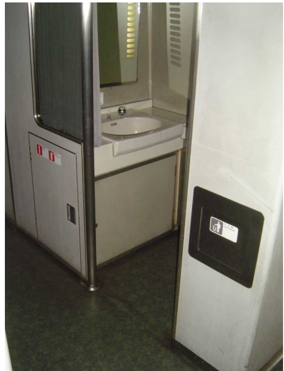
「タンゴディスカバリー」の洗面所