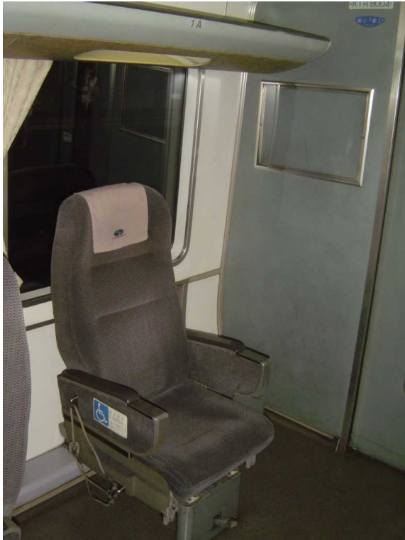
「タンゴディスカバリー」の 車いす対応座席