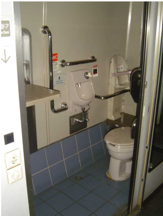
「タンゴディスカバリー」の多機能トイレ