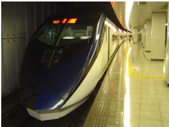
京成電鉄A E形「スカイライナー」