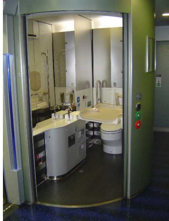
京成電鉄A E形「スカイライナー」の 多機能トイレ