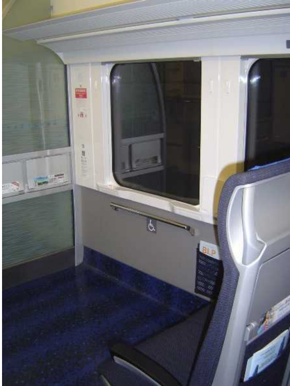
京成電鉄A E形「スカイライナー」の 車いすスペース