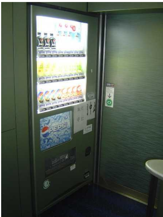
京成電鉄A E形「スカイライナー」の 飲料自動販売機 向かいのテーブルの下に右の写真の A E Dがある