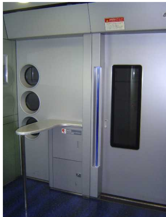
京成電鉄A E形「スカイライナー」の A E D