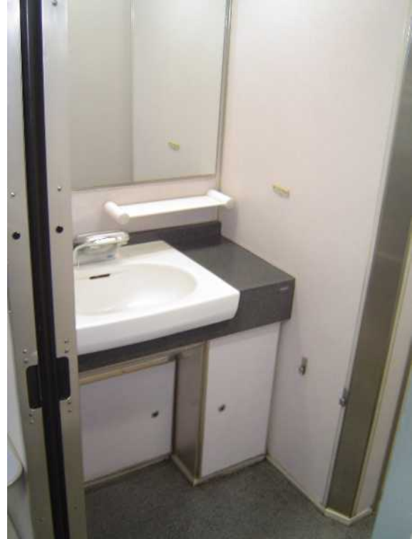
京成電鉄AE100形「シティライナー」 の洗面所