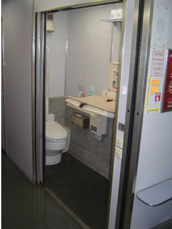
京成電鉄AE100形「シティライナー」 の多機能トイレ