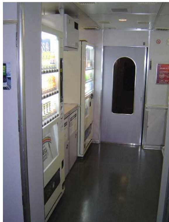
京成電鉄AE100形「シティライナー」 の飲料自動販売機