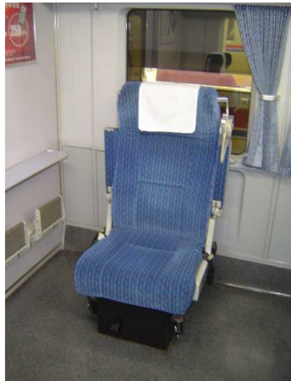
京成電鉄AE100形「シティライナー」 の車いす対応座席