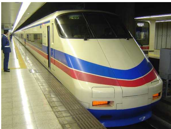
京成電鉄AE100形「シティライナー」