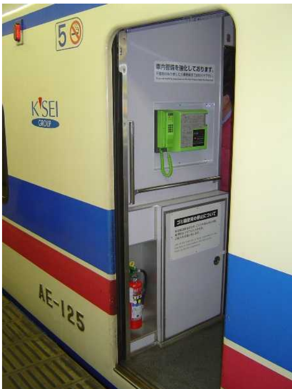
京成電鉄AE100形「シティライナー」 の公衆電話（現在は撤去）