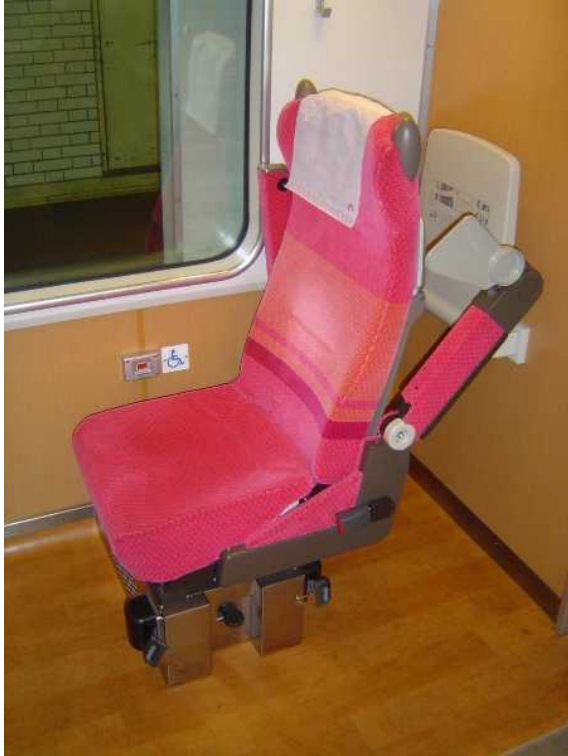
近鉄26000系「さくらライナー」の 車いす対応座席