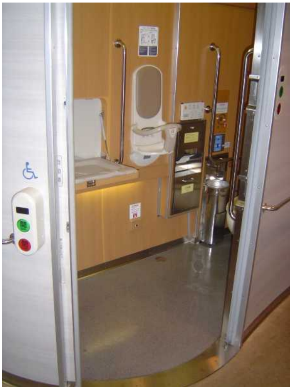
近鉄26000系「さくらライナー」の 多機能トイレ