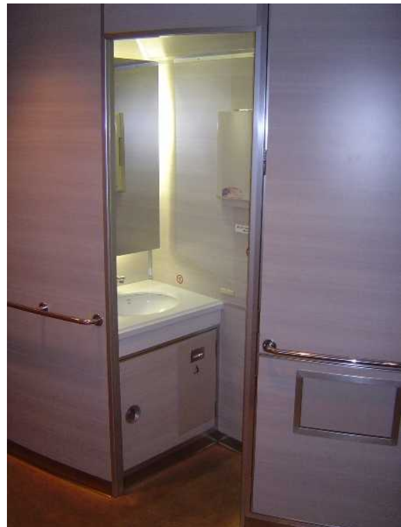
近鉄26000系「さくらライナー」の 多機能トイレの向かいにある洗面所 (車いす非対応)