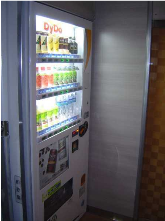
近鉄26000系「さくらライナー」の 飲料自動販売機(車いす非対応)