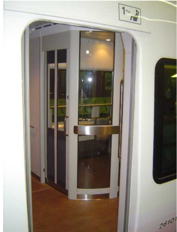
近鉄26000系「さくらライナー」の 喫煙コーナー