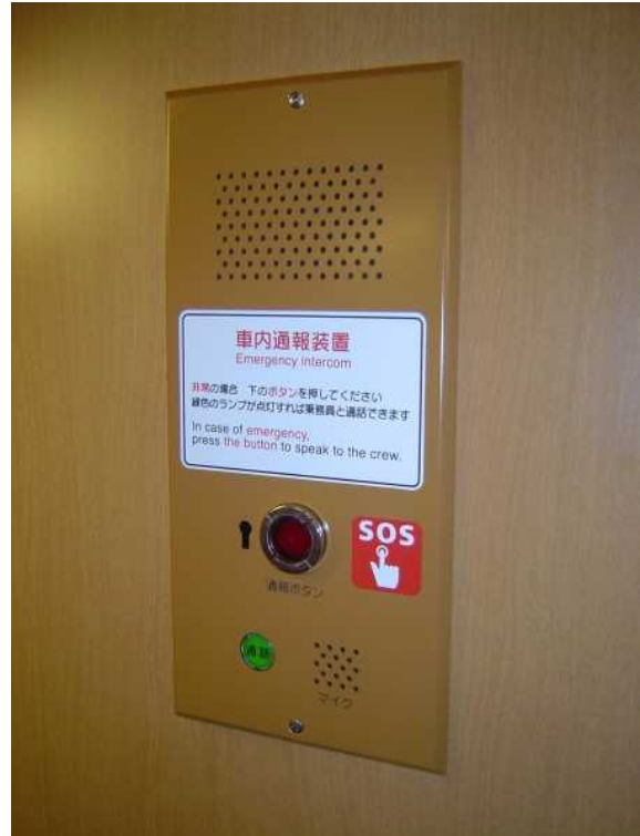
近鉄26000系「さくらライナー」の 車いす対応座席の壁側に設置された インターホン式の車内通報装置