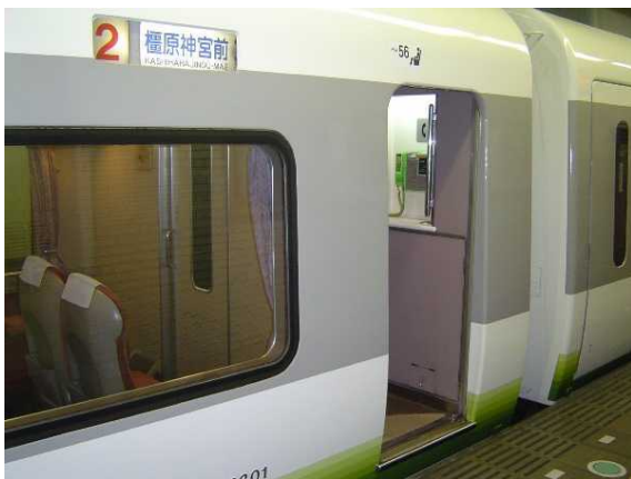
近鉄26000系「さくらライナー」の リニューアル前の2号車に設置されていた 公衆電話(車いす非対応、現在は撤去)