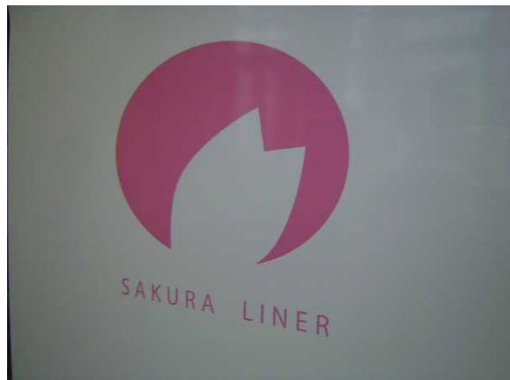
近鉄26000系「さくらライナー」