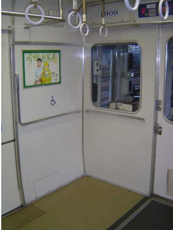
名古屋鉄道1800系の 車いすスペース