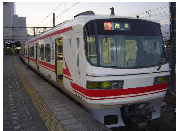
名古屋鉄道1800系 (増結用2両編成)