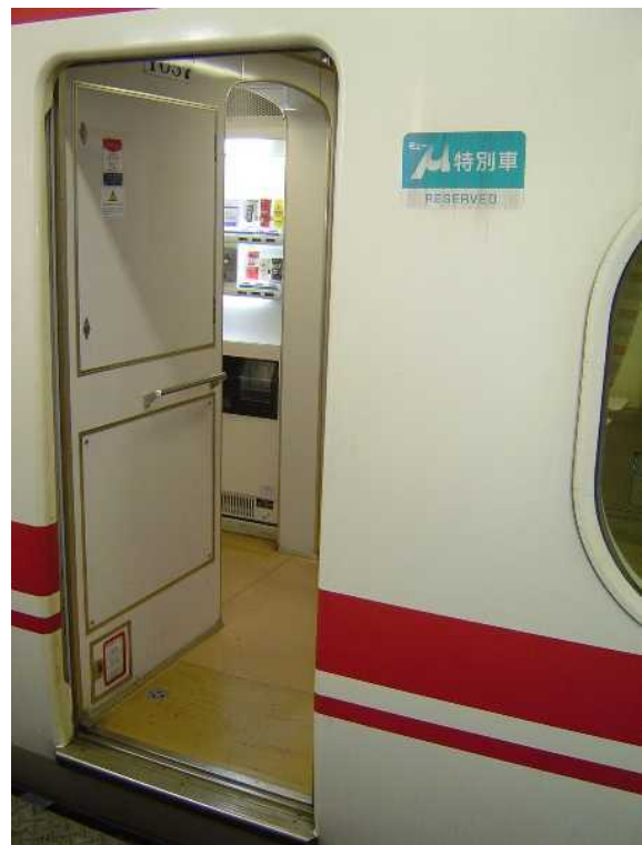
名古屋鉄道1000系特別車の 飲料自動販売機