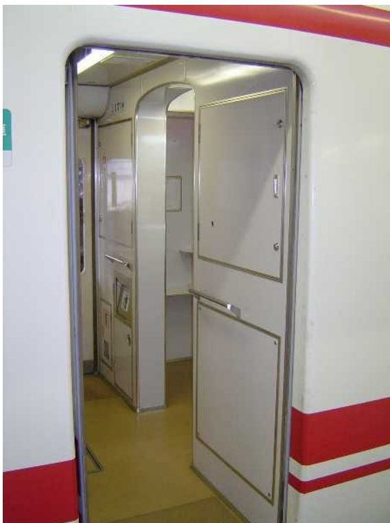
名古屋鉄道1000系特別車の 公衆電話撤去跡