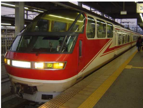
名古屋鉄道1000系の特別車