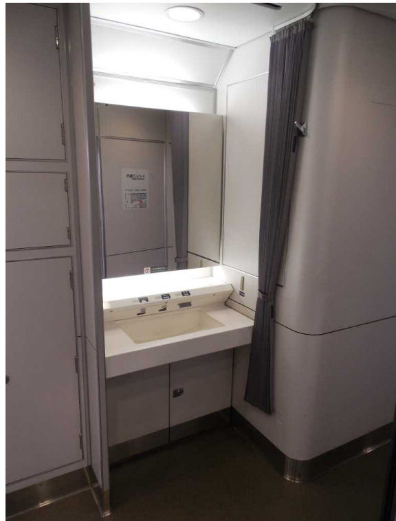
南海電鉄12000系「サザン・プレミアム」の 車いす対応洗面所