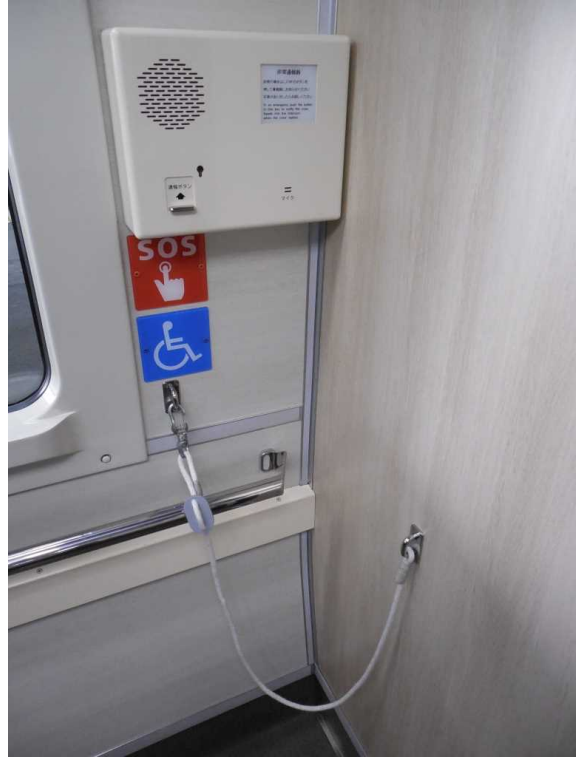
南海電鉄12000系「サザン・プレミアム」の 車いす固定ロープと非常報知器