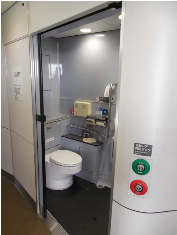
南海電鉄12000系「サザン・プレミアム」の 車いす対応トイレ