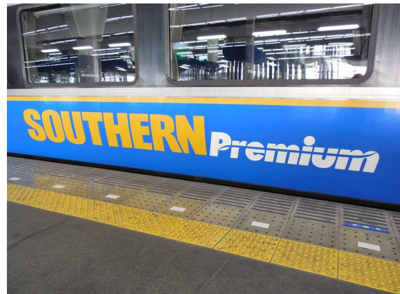
南海電鉄12000系「サザン・プレミアム」