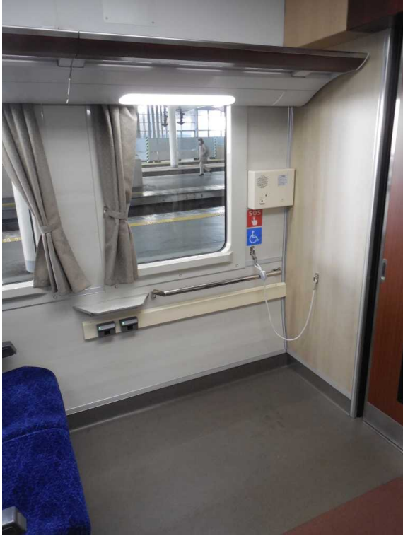
南海電鉄12000系「サザン・プレミアム」の 車いすスペース