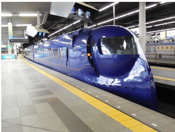
南海電鉄50000系「ラピート」