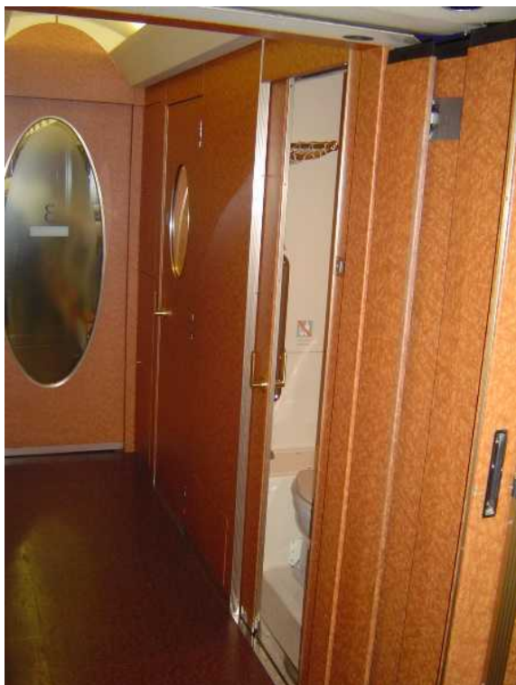
南海電鉄50000系「ラピート」の 車いす非対応トイレ