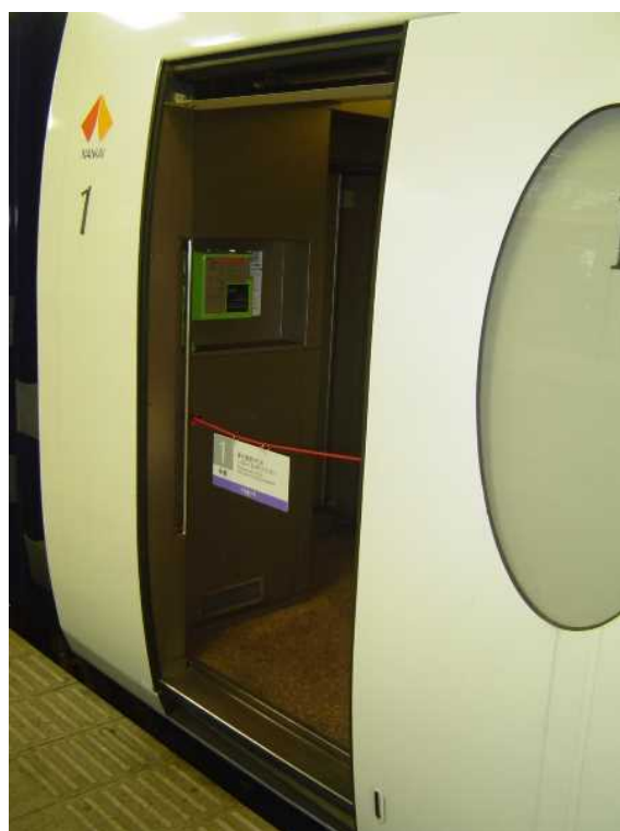
南海50000系「ラピート」の 1号車に設置されていた公衆電話 (車いす非対応、現在は撤去)