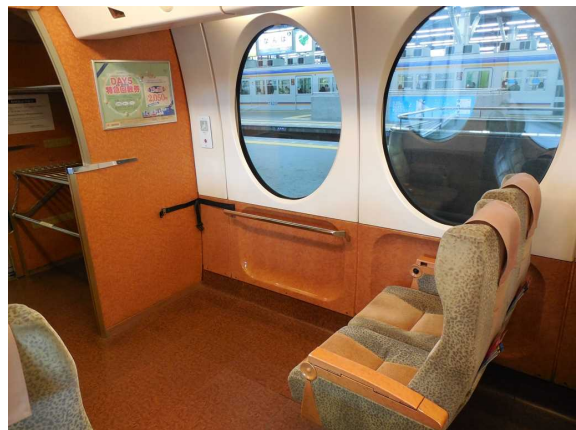
南海電鉄50000系「ラピート」の 車いすスペース