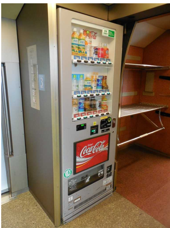
南海50000系「ラピート」の 飲料自動販売機(車いす非対応)