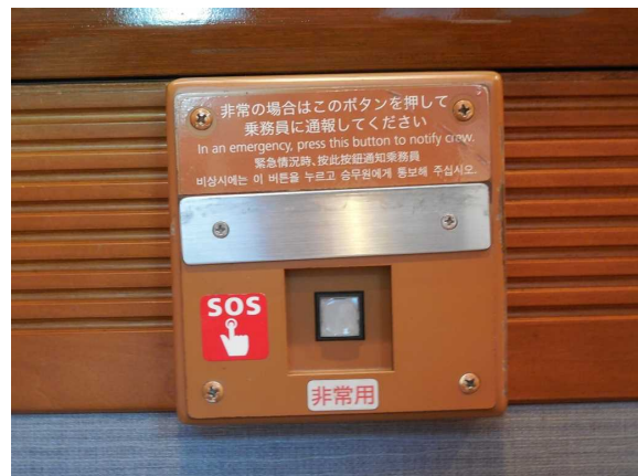
左の写真で肘掛けの上に見えている 非常通報ボタンの拡大写真