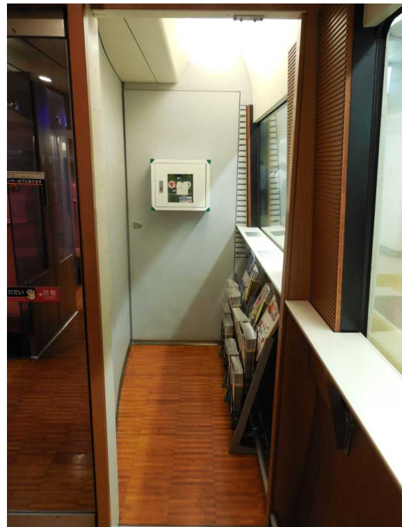
小田急電鉄50000形「VSE」の 3号車の旧・喫煙ブースに設置された AED