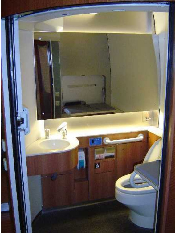
小田急電鉄50000形「VSE」の 8号車の多機能トイレ 3号車のトイレも同一構造