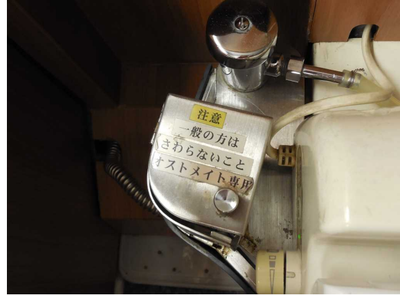
便器に併設されている オストメイト用パウチ洗浄装置のボタンの 格納部分