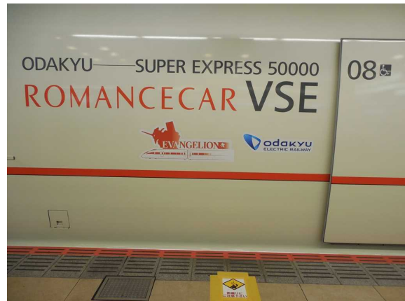
小田急電鉄50000形「VSE」の 車体側面のロゴ