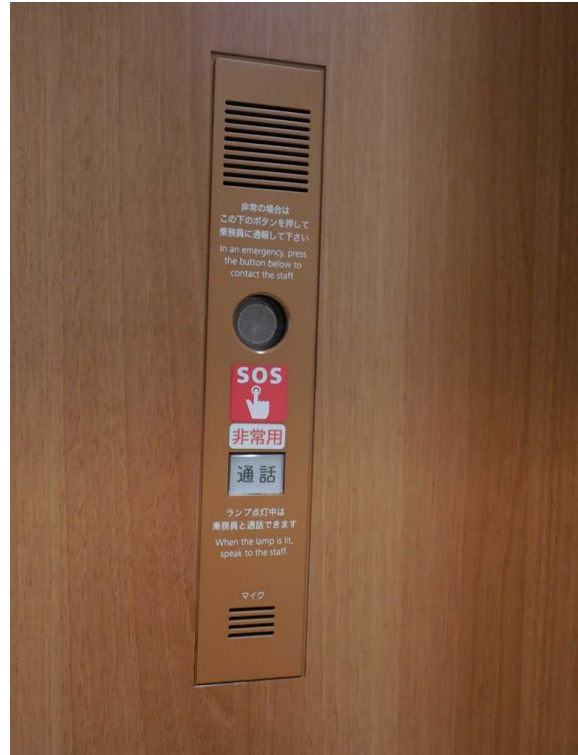
左の写真で前の壁に見えている 非常通話装置の拡大写真