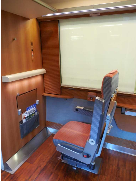
小田急電鉄50000形「VSE」の 車いす対応座席