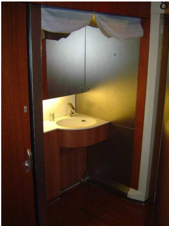
小田急電鉄50000形「VSE」の 8号車の洗面所