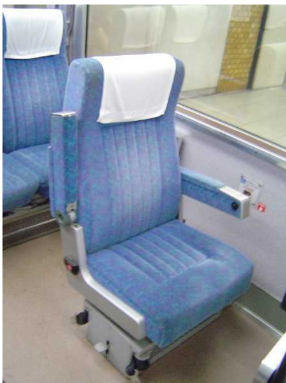
小田急電鉄7000形「LSE」の 車いす対応座席