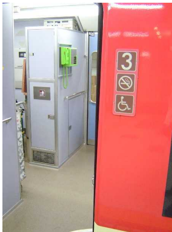
小田急電鉄7000形「LSE」の 3号車の公衆電話 (現在は撤去、跡にはAEDを設置)