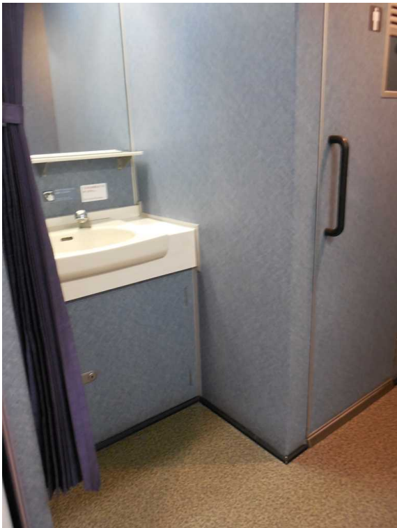
西武鉄道10000系「ニューレッドアロー」の 洗面所