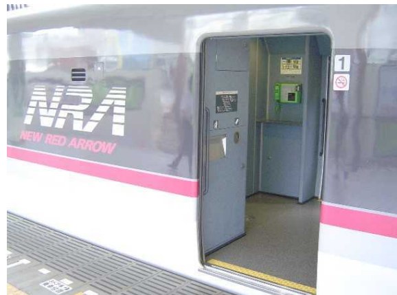
西武鉄道10000系「ニューレッドアロー」の 車体側面のロゴと公衆電話 (公衆電話は既に撤去済み)