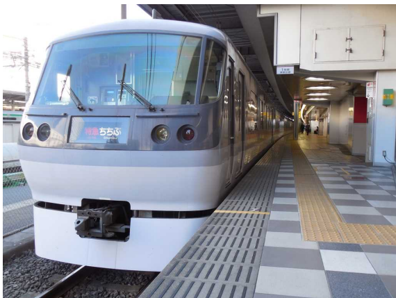
西武鉄道10000系「ニューレッドアロー」