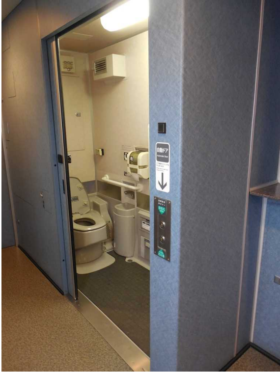
西武鉄道10000系「ニューレッドアロー」の 車いす対応トイレ