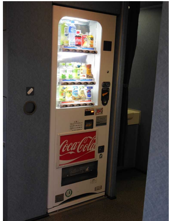
西武鉄道10000系「ニューレッドアロー」の 飲料自動販売機