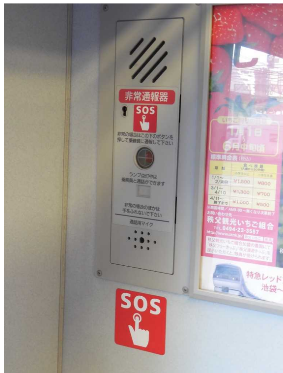
上の写真の右上に見えている非常通報器