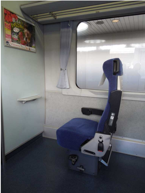
西武鉄道10000系「ニューレッドアロー」の 車いす対応座席(1号車10番A席) こちら側には非常通報器は 設置されていない