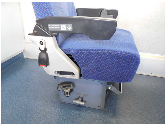
西武鉄道10000系「ニューレッドアロー」の 車いす固定ベルト