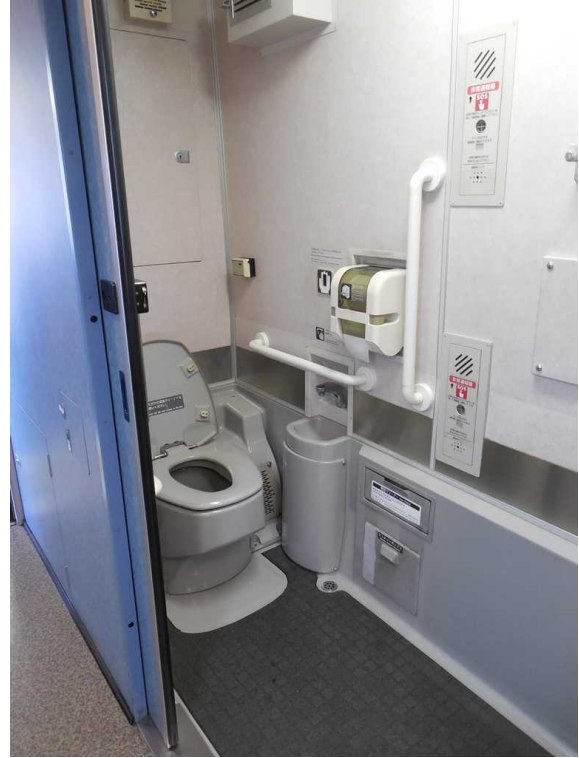
西武鉄道10000系「ニューレッドアロー」の 車いす対応トイレ内の非常通報器