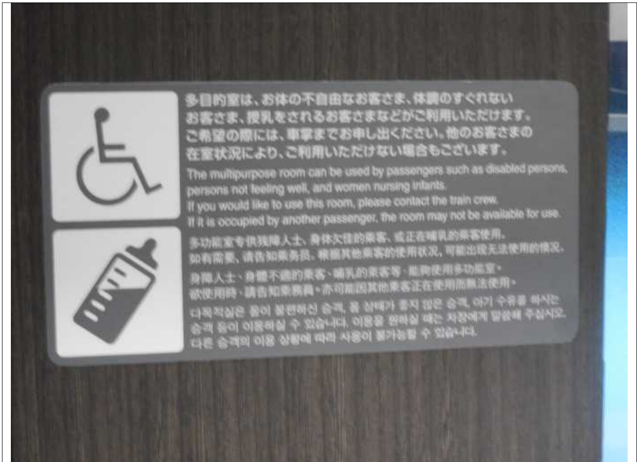
E3系の多目的室の案内掲示。 2020年2月23日（日曜日）の「つばさ148号」（L53編成）で撮影。