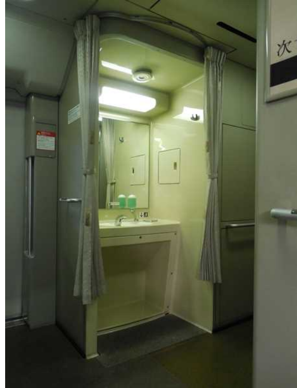
700系(JR西日本B編成)11号車の 車いす対応洗面所