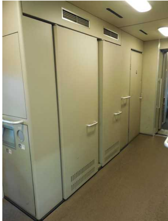
700系(JR西日本B編成)11号車の 飲料自動販売機撤去跡