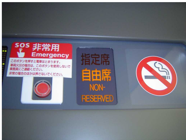
700系(JR西日本B編成)の 文字案内表示盤に併設されている 非常停止ボタン 車いすの人では手が届かない高さ