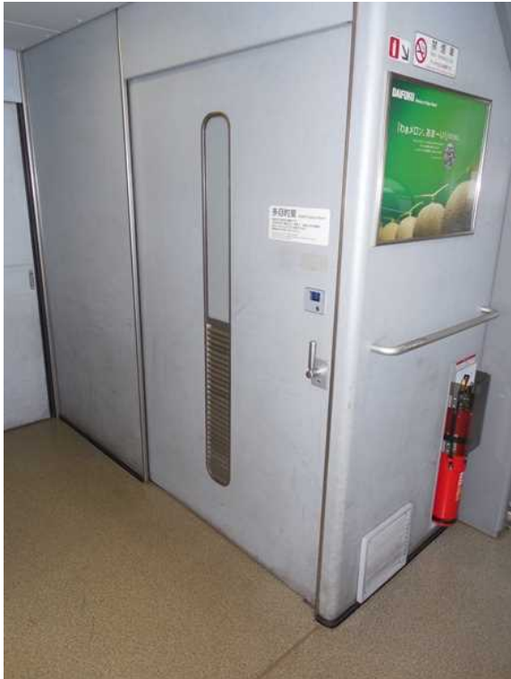
700系(JR東海C編成)11号車の多目的室の外観