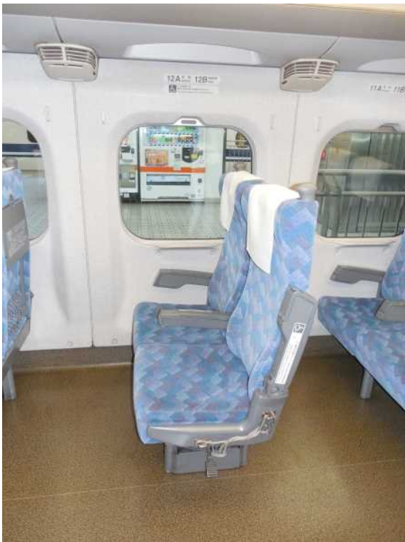
700系(JR東海C編成)11号車の 車いす対応座席