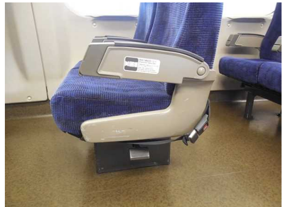
左の写真の座席の車いす固定ベルト部分