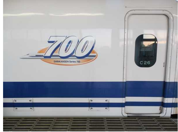
東海道～山陽新幹線700系(16両編成)