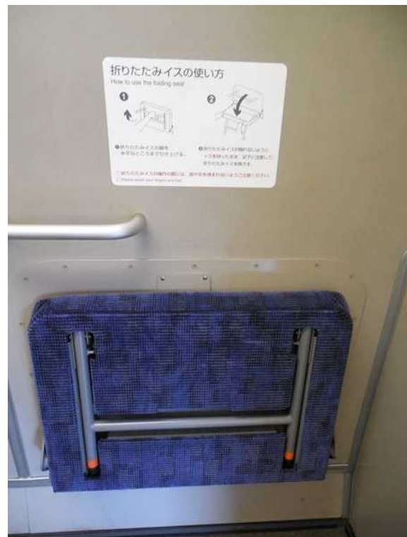
左の写真で右端に映っている折りたたみイス