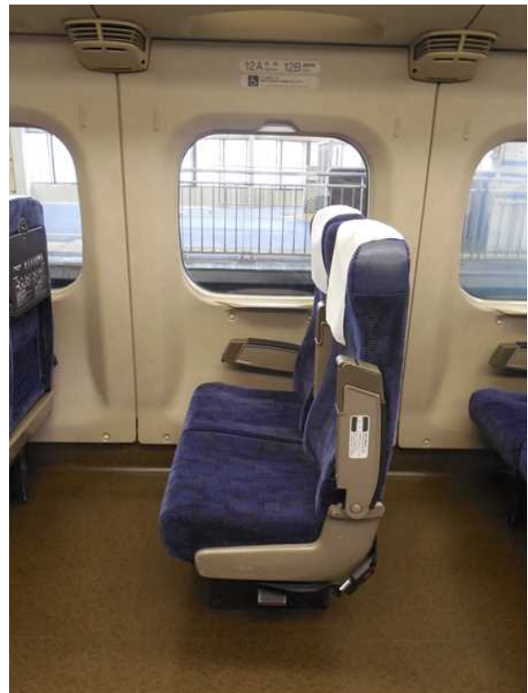
700系(JR西日本B編成)11号車の 車いす対応座席