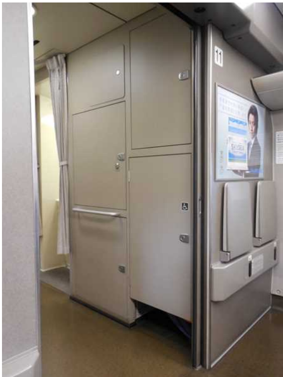
700系(JR西日本B編成)11号車の 車内専用車いす(バギー)の格納庫