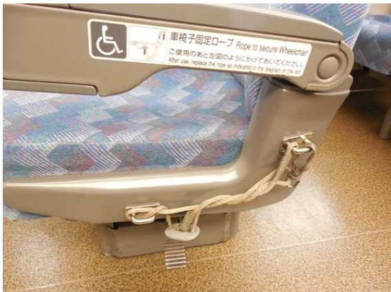
上の写真の座席の車いす固定ロープ部分