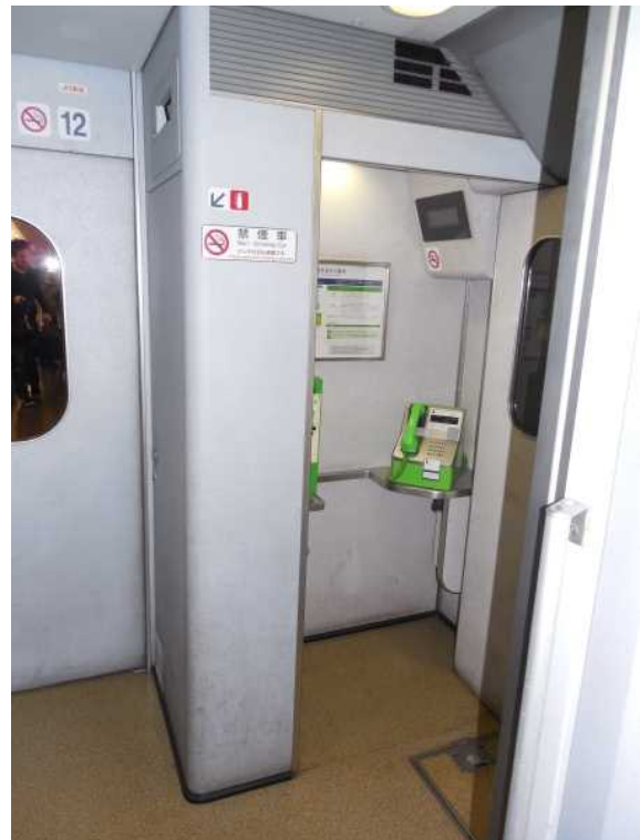
700系(JR東海C編成)12号車の 車いす対応電話室 電話機の上部の壁に 列車名表示器が設置されている