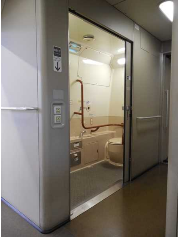
700系(JR西日本B編成)11号車の 車いす対応トイレ