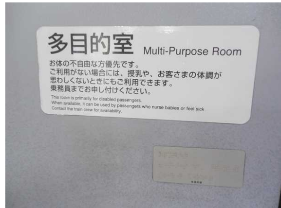
700系(JR東海C編成)11号車の多目的室の案内掲示(点字での案内にも注目)