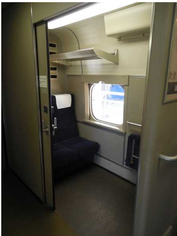
700系(JR西日本B編成)11号車の多目的室の内部(電動車いすの人が乗車してくる直前に乗務員の許可を得て撮影)