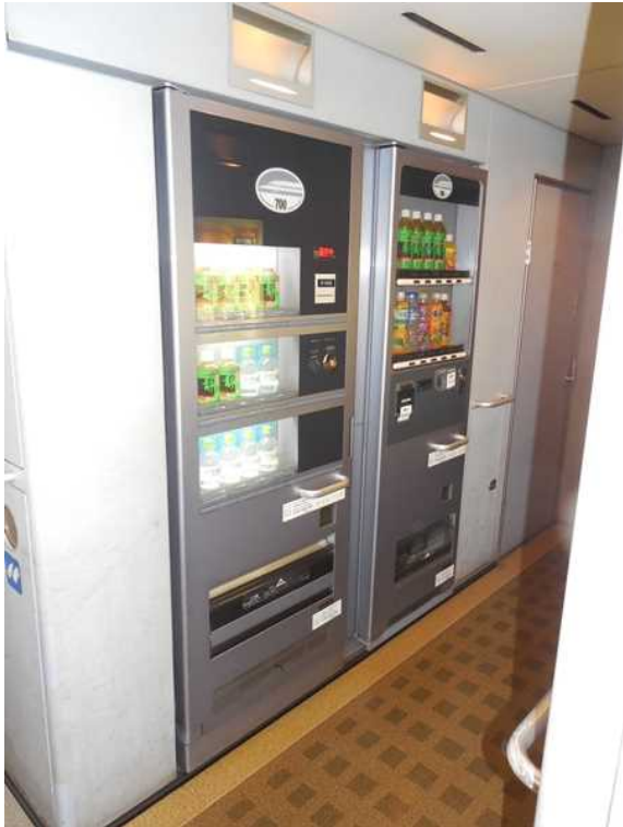
700系(JR東海C編成)の11号車に 2014年3月まで設置されていた 飲料自動販売機(車いす非対応)