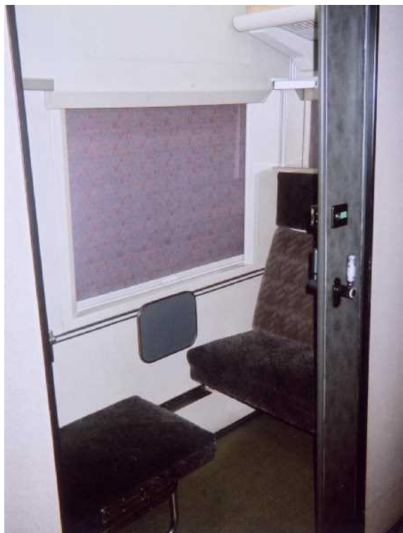
11号車の多目的室 2007年の調査列車で車内販売乗務員が 開錠し商品置き場として占拠していたとき 乗務員に商品をどけてもらって撮影