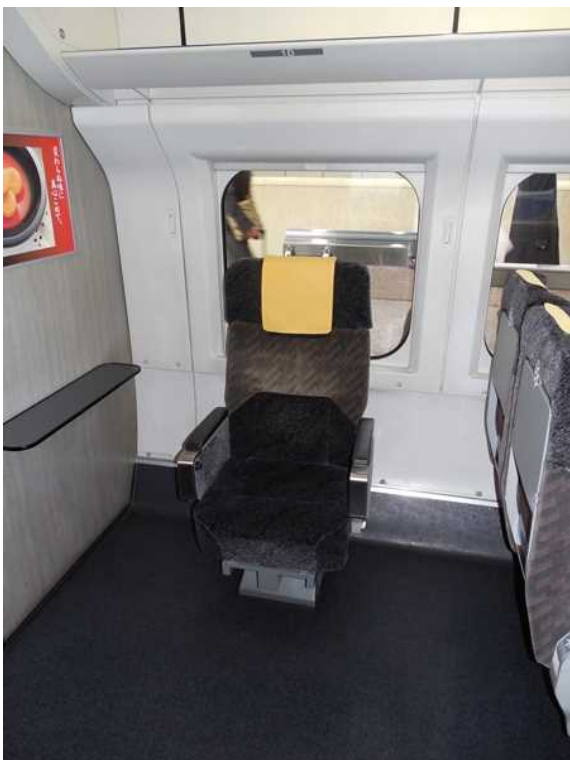
1 2 号車（普通車）の車いす対応座席