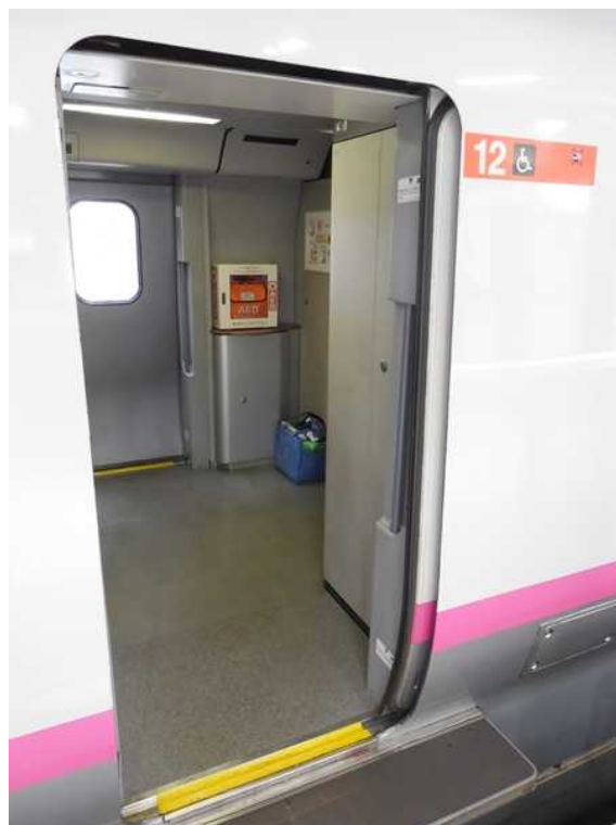
12号車の公衆電話撤去跡に設置された AED