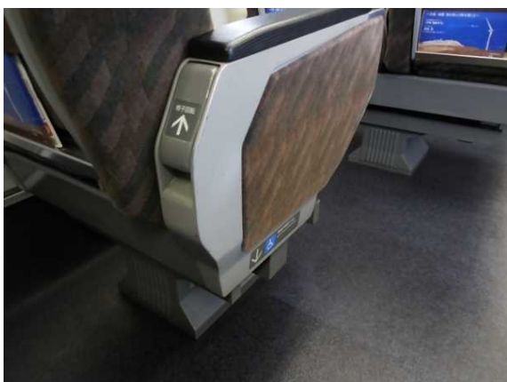
E 3 系の普通車の座席回転レバー 矢印部分を上にこじると回転できる