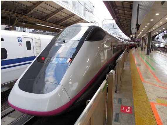
秋田新幹線用 E 3 系