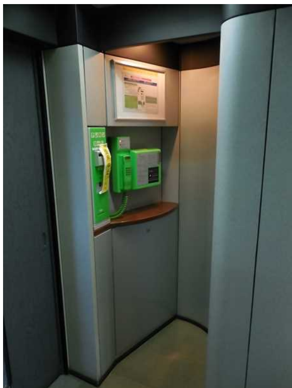
13号車の公衆電話（車いす非対応） 15号車の電話室も同一構造