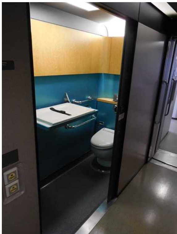
11号車の多機能トイレ