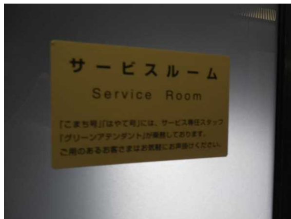
11号車の多目的室のドアに 掲出されている案内掲示