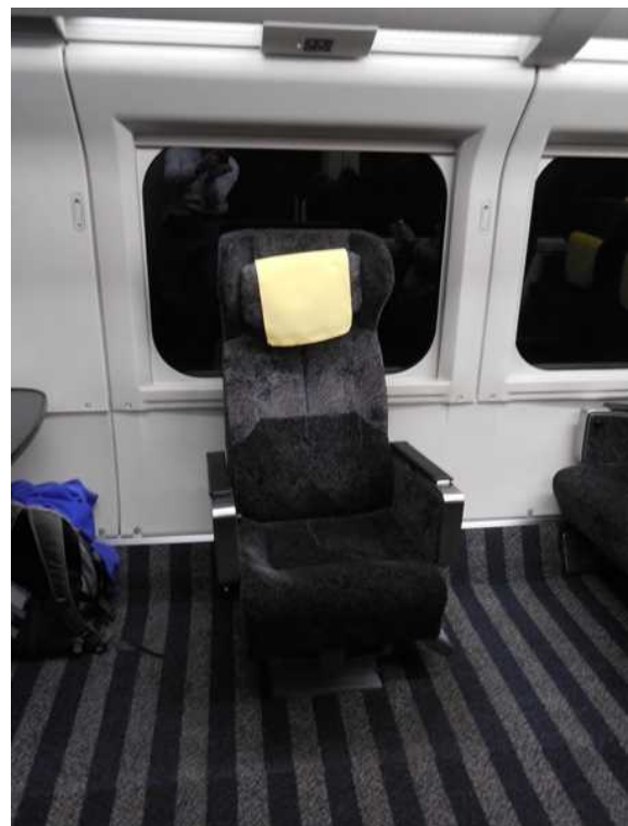
1 1 号車（グリーン車）の車いす対応座席