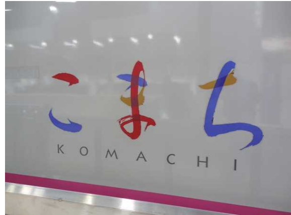
E 3 系の車体側面のロゴ