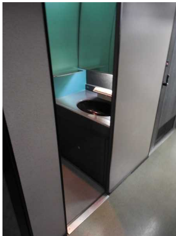
11号車の洗面所（車いす非対応）