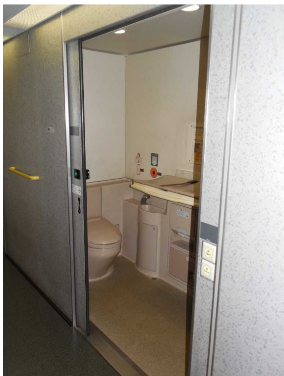
E 4 系 5 号 車 の 多 機 能 ト イ レ ( 8 号 車 の 多 機 能 ト イ レ も 同 一 構 造 )