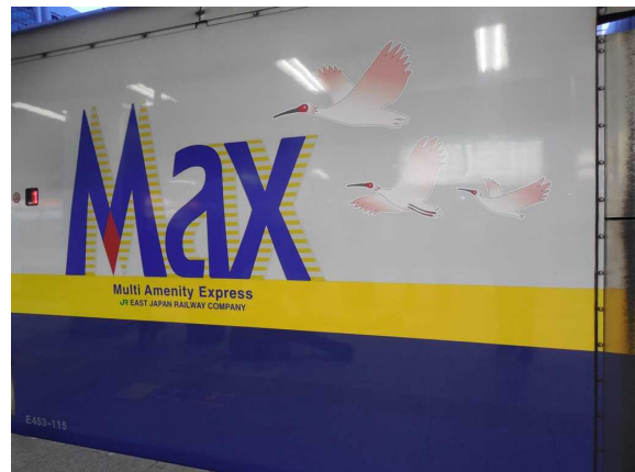
上越新幹線 E 4 系 車体側面のロゴのデザインは 2 種類ある