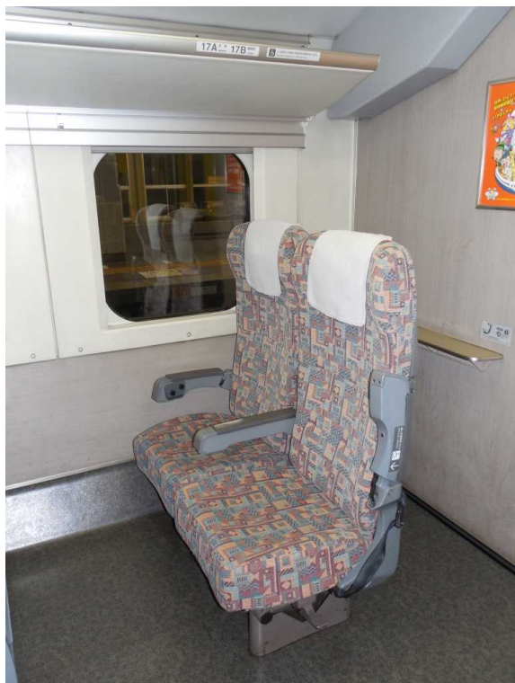
E 4 系 6 号 車 ( 普 通 車 ) の 車いす対応座席