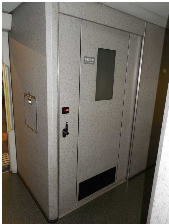
E 4 系 8 号車の多目的室の外観 ( 内部は未撮影 )