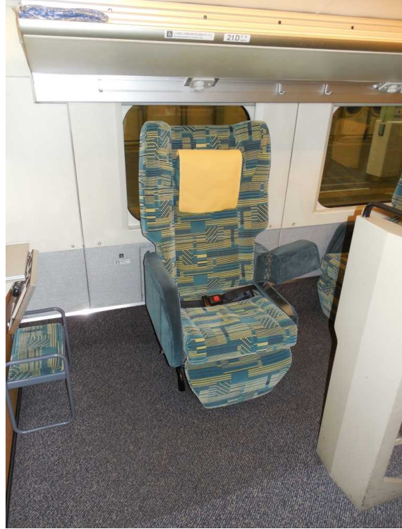
E 4 系 8 号 車 ( グ リ ー ン 車 ) の 車 い す 対 応 座 席 腰 掛 左 側 の 肘 掛 け の み 通 路 側 に 開 く こ と が で き る ( 右 側 は 開 け ない ) 腰 掛 を 東 京 方 面 へ 向 け た 場 合 の み 、 こ の 機 能 を 利 用 で き る