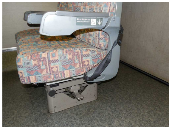
E 4 系 6 号 車 ( 普 通 車 ) の 車いす固定ベルト