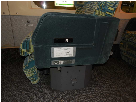
E 4 系 8 号 車 ( グ リ ー ン 車 ) の 車 い す 固 定 ベ ル ト と 肘 掛 け の 開 き 方 の 説 明 文 壁 側 に は 非 常 連 絡 用 プ ザ ー の 押 ボ タ ン も 見 え る