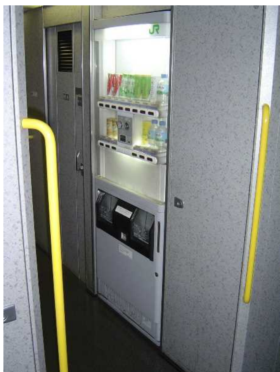
2 0 0 8 年 3 月 3 1 日 まで E 4 系 の 4 号 車 に 設 置 さ れ て い た 飲 料 自 販 機 ( 車 い す 非 対 応 、 現 在 は 撤 去 )