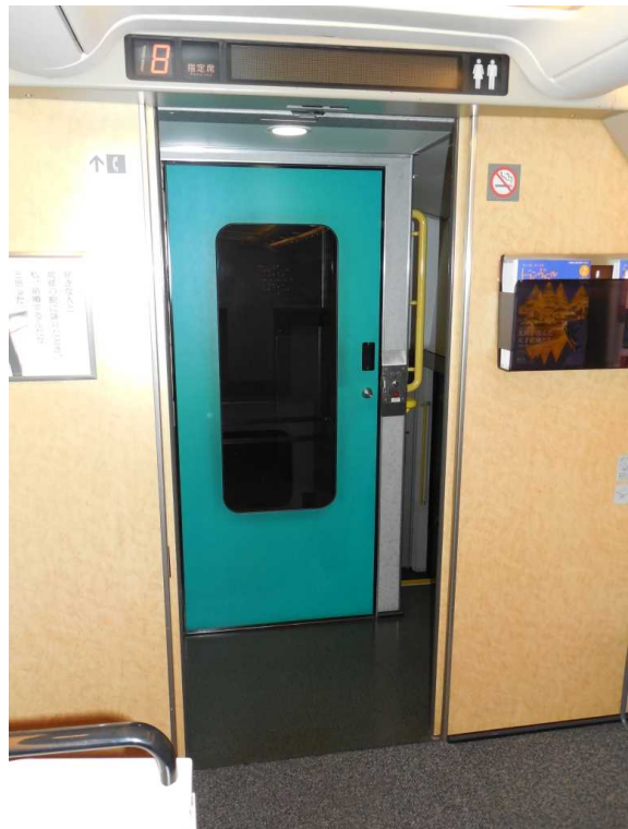
E 4 系 8 号 車 の 車 い す 昇 降 リ フ ト 車 内 販 売 ワ ゴ ン 用 の リ フ ト を 8 号 車 だ け 車 い す 対 応 の 大 き さ と し た も の