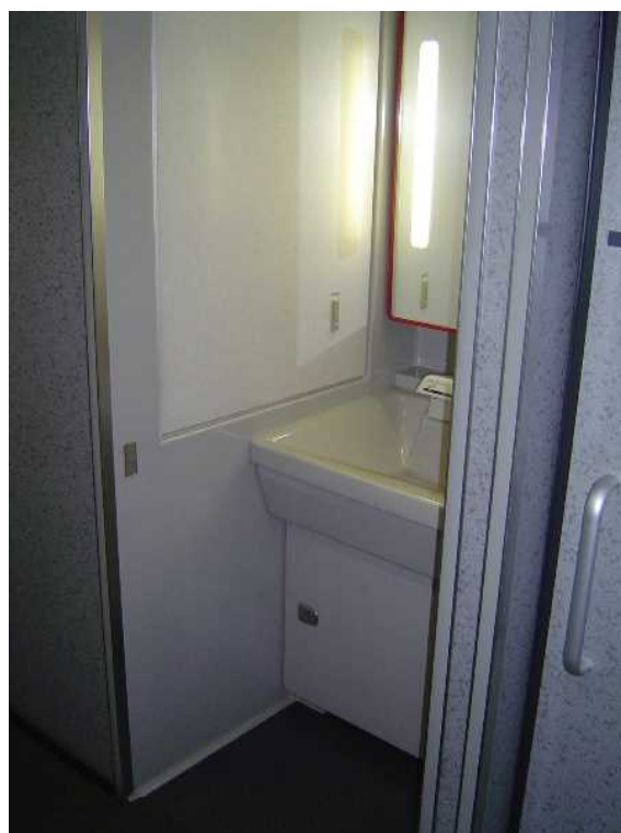
E 4 系 8 号 車 の 洗 面 所 ( 5 号 車 の 洗 面 所 も 同 一 構 造 )