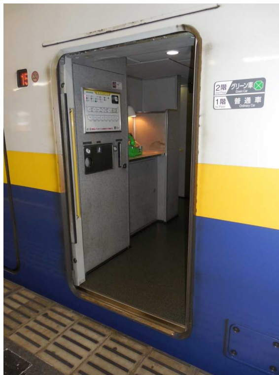
E 4 系 7 号車の公衆電話 ( 現在は撤去 )