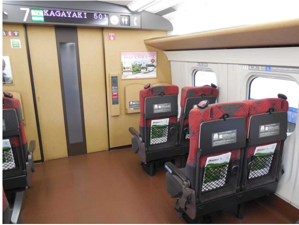
E 7 系 7 号車の車いす対応座席（右手前） と非常通話装置（中央）との位置関係