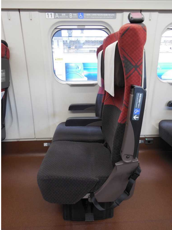
E 7 系 7 号 車 ( 普 通 車 ) の 車いす対応座席