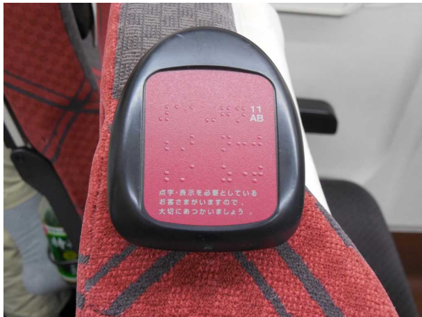
E 7 系の普通車の座席の 枕元に設置されている 点字での座席番号案内