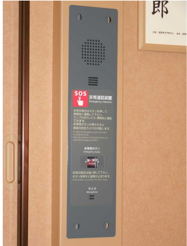
E 7 系 7 号車の車いす対応座席付近の 非常通話装置