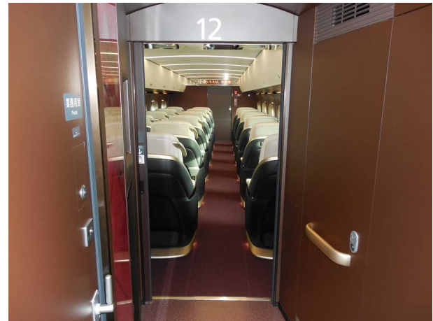
E7系12号車（グランクラス） 通路幅が狭いため車いすでの利用は不可