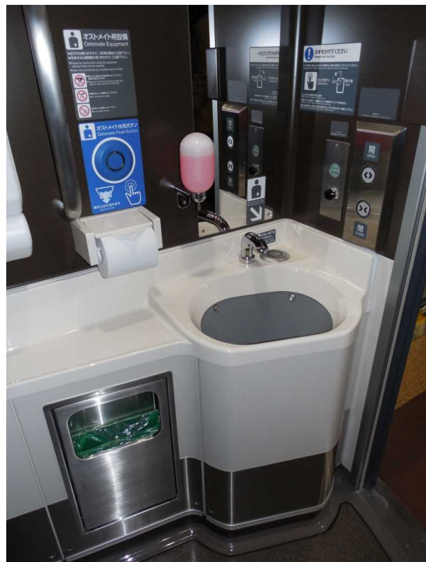
E 7 系 7 号車の多機能トイレ内にある オストメイト用設備 東海道・山陽新幹線 N 7 0 0 系のものと ほぼ同じタイプ