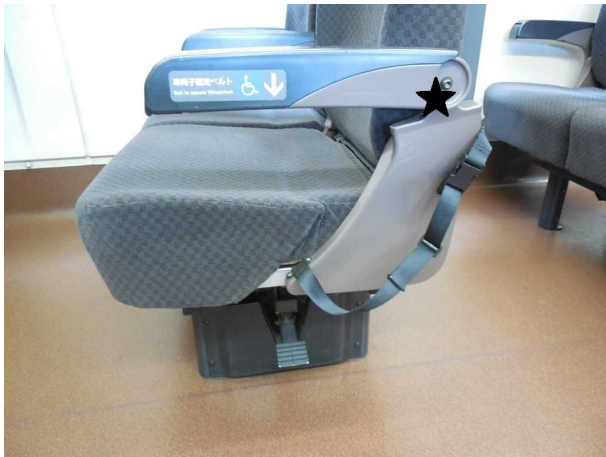
普通車の車いす固定ベルト 肘掛けを跳ね上げるには 印部分の内側 ( 背もたれ側 ) に隠れているボタンを 押しながら操作する必要があるが その旨の案内掲示はどこにも無い