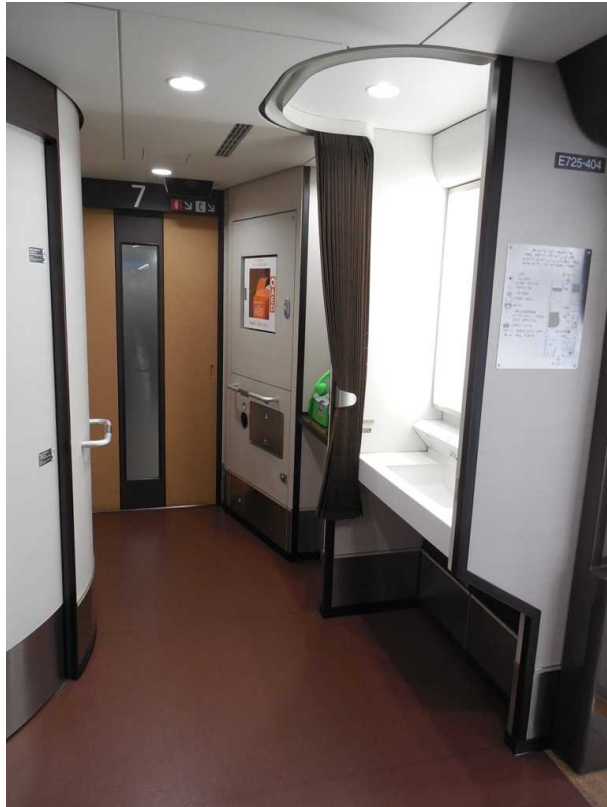
E7系7号車の車いす対応洗面所と 公衆電話（現在は撤去）AED 画面の左端は多目的室