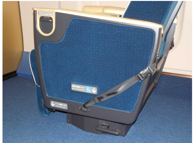
グリーン車の車いす固定ベルト