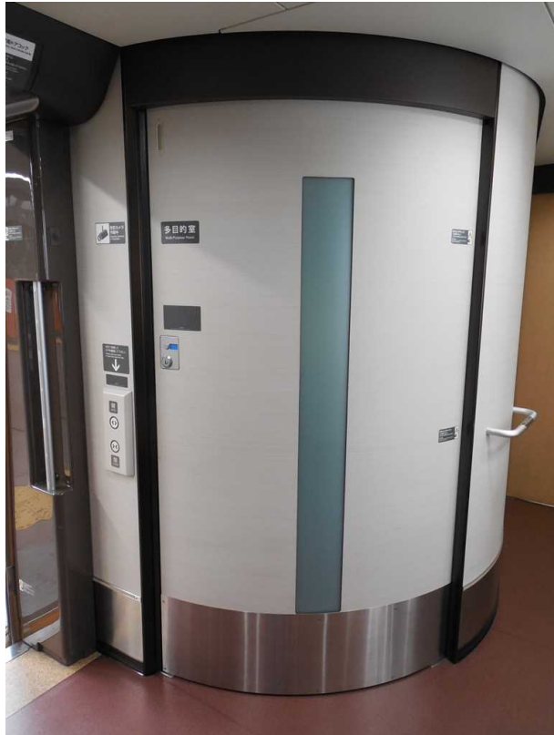
E 7 系 7 号車の多目的室 ( 内部は未撮影 )