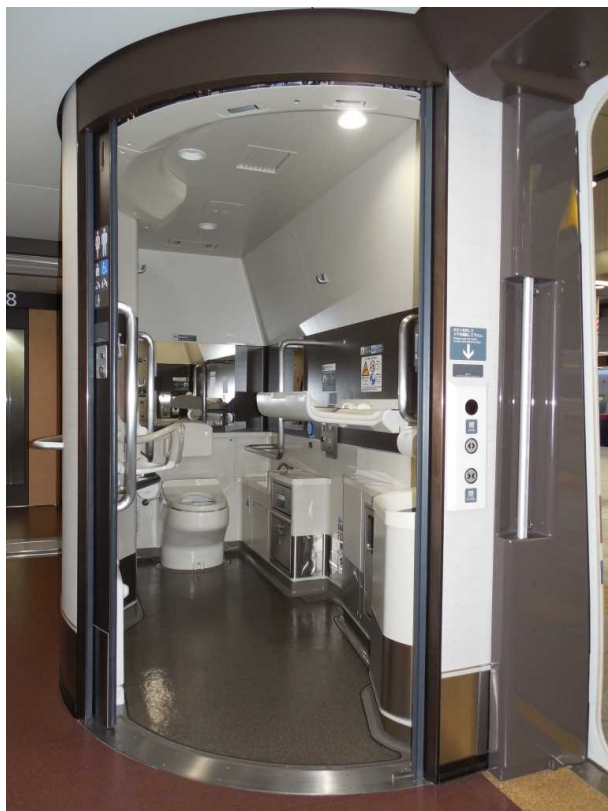
E 7 系 7 号車の多機能トイレ ( 1 1 号車の多機能トイレも同一構造 ) 左側手前には折り畳み式の チェンジングボード ( 着替え台 ) があ