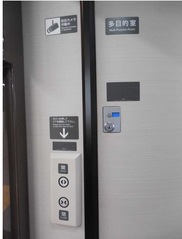
E 7 系 7 号車の多目的室の案内掲示