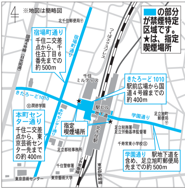
図2 北千住駅周辺の禁煙特定区域

千住のパトロールの様子。地域の方から「街がだいぶきれいになった」との声をいただきました