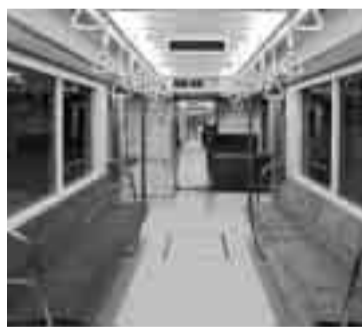
ロングシートの色は、濃いブルー

「花の散歩路」をつくり 育てる! 参加者募集 「花の散歩路」は、区内にある 日暮里・舎人ライナー各駅と、 その沿線にある公園や公共施 設、個人宅の庭先や店舗前など を花や緑で結ぶ散歩コースをつ くる事業のことです。 この事業は、花づくりの楽し みを通し、地域の方々が交流を 深め、ネットワークを広げる場 所として、身近な公園などを積 極的に利用してもらうことをめ ざしています。地域の皆さんの 参加をお待ちしています。くわ しくはお問い合わせください。 問い合わせ先「公園事業係 ☎(3880)5919